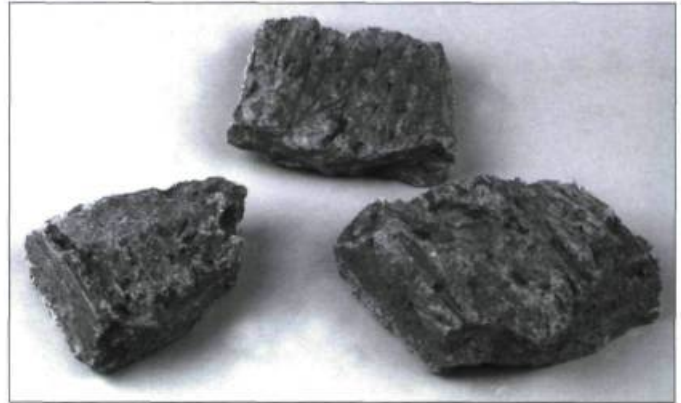
Quelques fragments de hourdis sur lesquels on distingue des empreintes de graminées.

s'inspirait de la tradition de l'ouest de la France. Bien que des zones d'ombre subsistent sur son année de construction, un fait demeure clair : la maison Couillard-Hébert constitue l'un des rares sites de colo-