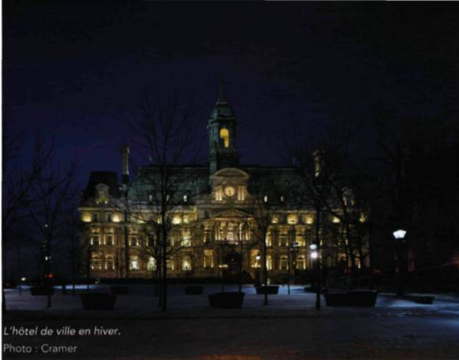
L'hôtel de ville en hiver.

et un contraste entre les toits. Audacieux et festif, l'éclairage se transforme pour souligner une période de réjouissances ou marquer une thématique : alternance de couleurs durant les fins de semaine, drapé de bleu durant le défilé de la Saint-Jean-Baptiste.