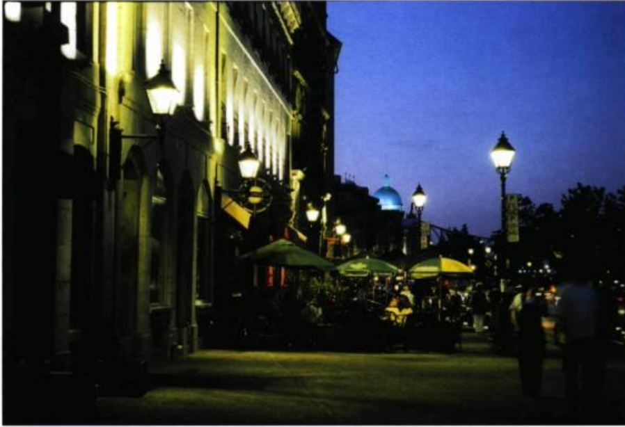
La rue de la Commune.

Rue de la Commune Face au Vieux-Port, le paysage illuminé du front fluvial offre un véritable panorama de carte postale. Balayées de lumière ambre, avec un rayon bleuté pour marquer la mitoyenneté des bâtiments, les façades de calcaire gris s'unissent en un superbe « front de fleuve », selon un tracé suivant de près celui des berges et des fortifications du XVIII e siècle.