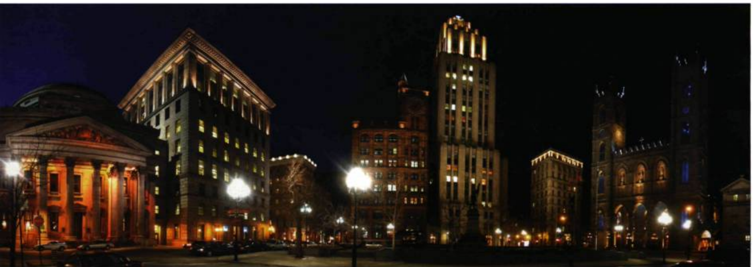
La place d'Armes, une pièce maîtresse du plan lumière du Vieux-Montréal.

Place d'Armes La place d'Armes offre un formidable condensé d'histoire. Des témoins de toutes les périodes y sont rassemblés autour d'un monument consacré aux fondateurs. Pour mettre en valeur cette place unique, on a choisi d'en rehausser la silhouette en éclairant le couronnement des immeubles, qui se découpent ainsi dans le paysage nocturne. La teinte bleutée qui illumine l'intérieur des clochers de la basilique Notre-Dame évoque les couleurs de