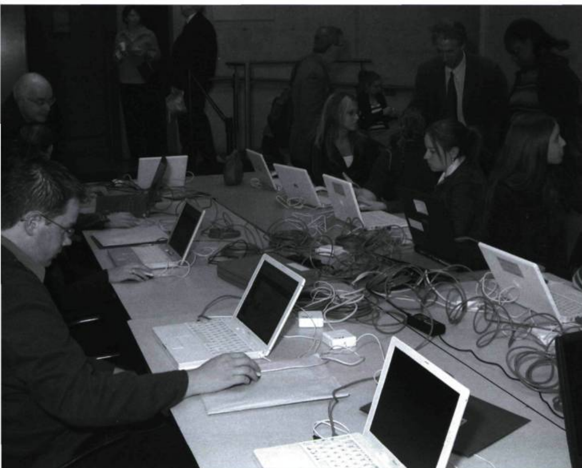
Des élèves de la polyvalente C. Armand-Racicot présentant leur travail réalisé sur le site Web du Musée, lors d'une journée d'études tenue au Musée McCord, en collaboration avec la Commission scolaire de Montréal, le 23 octobre 2003.