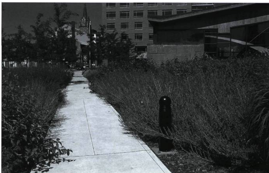
Aménagement paysager récent aux abords du métro Champs-de-Mars à Montréal.