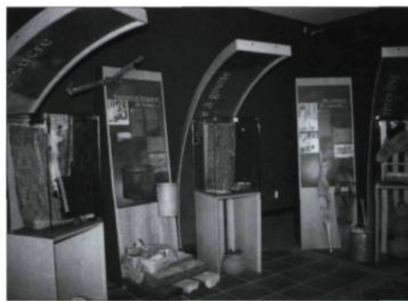
« De l'eau... à la bouche », l'exposition permanente de la Maison des cultures amérindiennes est une entrée en matière pour le visiteur qui souhaite apprivoiser les saveurs et les traditions culinaires amérindiennes.