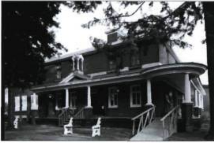
À Odanak, le plus ancien des musées autochtones témoigne de la culture abénakise depuis 1962 déjà.