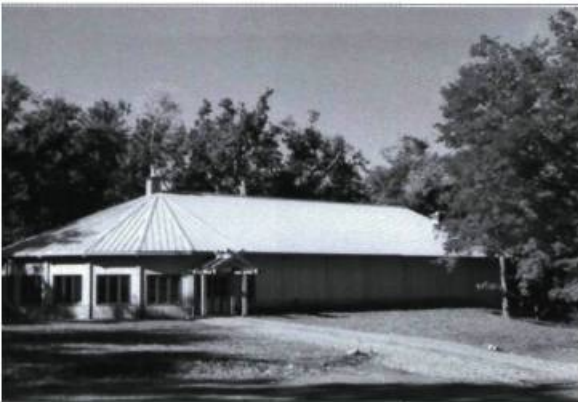
La Maison des cultures amérindiennes à Mont-Saint-Hilaire est un lieu d'échanges, de partage et de rapprochement des peuples.