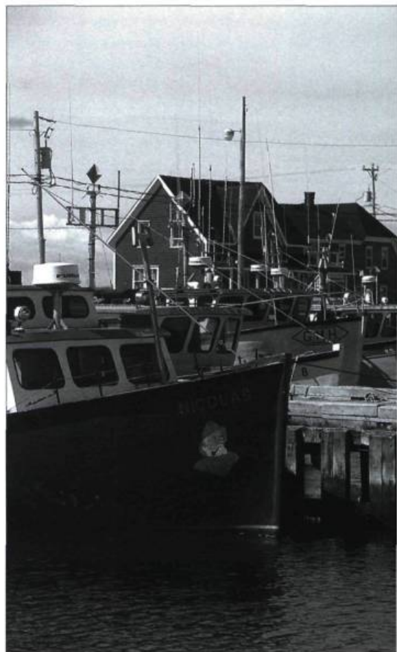
Servant de port d'attache pour les pêcheurs de homard de Grande-Entrée aux Îles-de-la-Madeleine, ce quai extrêmement actif sera agrandi au cours de la prochaine année.

Enfin, des administrations portuaires autonomes (APA) ont été constituées à Montréal, Trois-Rivières, Québec, Port-Saguenay et Sept-Îles. Et Transports Canada s'appête à céder les quais de Portneuf, Pointe-au-Pic, Cacouna, Mont-Louis, Gaspé et Havre-Saint-Pierre. Dans l'estuaire du Saint-Laurent, aucun port n'est classifié de pêche, ce qui réduit la plupart des ports à un statut de plaisance, ce dont on se débarrasse.