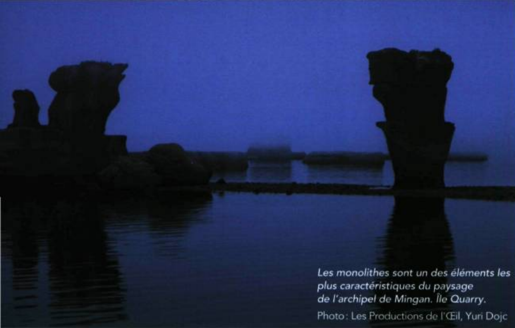
Les monolithes sont un des éléments les plus caractéristiques du paysage de l'archipel de Mingan. Île Quarry.

anciens chasseurs montagnais. Pour les Québécois, Betsiamites représentera longtemps le début du Labrador, ce territoire ancien et méconnu où vivent les Amérindiens et les pêcheurs.