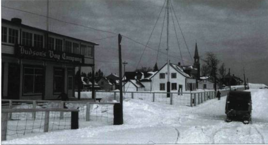
Betsiamites, à environ 50 kilomètres en amont de Baie-Comeau, en janvier 1945. À gauche, un comptoir de la Compagnie de la Baie d'Hudson, établie dans le village en 1855.