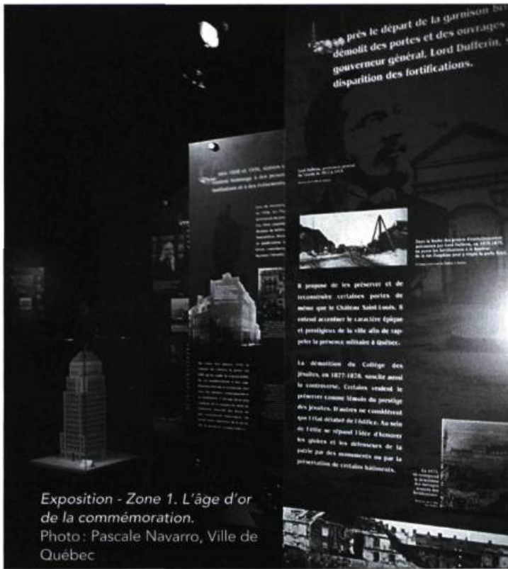
Exposition - Zone 1. L'âge d'or de la commémoration.

Cette approche nous a valu de francs succès. Archibus Québec, un concept de circuits d'architecture et d'urbanisme développé avec le Conseil des monuments et sites du Québec est fréquemment cité comme une réussite du genre. Son approche ludique de l'environnement urbain a plu aux jeunes autant qu'aux adultes. Nous sommes aussi particulièrement fiers d'avoir imaginé des activités telles que La ville imagée par l'enfant , À l'école de la ville , L'architecture et le fer . Avec ces programmes adaptés pour les enfants du préscolaire et du primaire, nous avons initié des milliers de jeunes de 4 à 12 ans à leur ville. Plus de 40 expositions ont également permis au grand public de mieux voir la cité sous des aspects parfois inattendus. La dernière exposition en date, Le Vieux-Québec, 1871-2008. Enjeux et débats , traite, comme son nom l'indique, des grands projets qui ont façonné Québec et des discussions qu'ils ont provoquées sur la place publique.