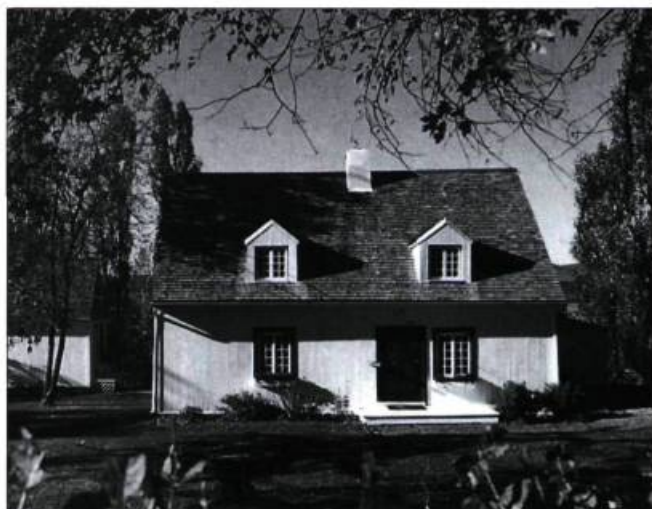
Au fil des ans, le programme d'aide à la restauration a contribué à l'amélioration de la qualité des ensembles bâtis patrimoniaux.

1451, ch. Royal, Saint-Jean, I.O. G0A 3W0 Tél. : (418) 829-2630