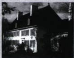
Construit en 1734

Une invitation à découvrir une résidence seigneuriale du XVIII e et ses meubles de collection.