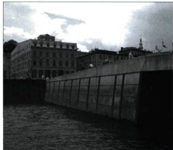
Vieux-Port de Québec : un quai n'est pas nécessairement synonyme d'accès et d'usage de l'eau.

À l'aube de l'an 2000, rades et bassins fluviaux trouveront leur rentabilité en offrant une polyvalence