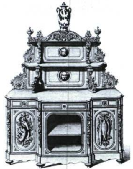
Au milieu du XIX e siècle, les buffets de salle à manger sont le plus souvent dans le style néo-Renaissance. Planche n° 441 du Garde-Meuble Ancien et Moderne/Collection de Meubles (Paris, XIX e siècle), provenant du fonds du meublier québécois Honoré Roy dit Belleau. Collection du Service canadien des parcs, région du Québec.

Plus qu'un reflet fidèle des époques antérieures, la propension à puiser aux formes du passé nous transmet du XIX e siècle, par l'intermédiaire du mobilier et des décors intérieurs, un portrait de ses goûts et de ses ambitions.