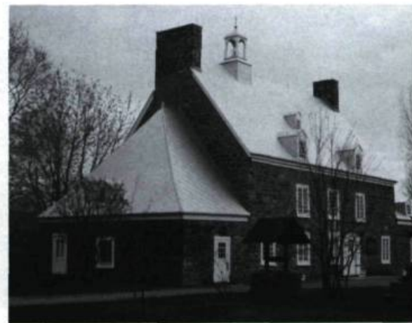
La Maison Saint-Gabriel, ancienne maison de ferme reconstruite en 1698 après un incendie, constitue aujourd'hui un site unique.