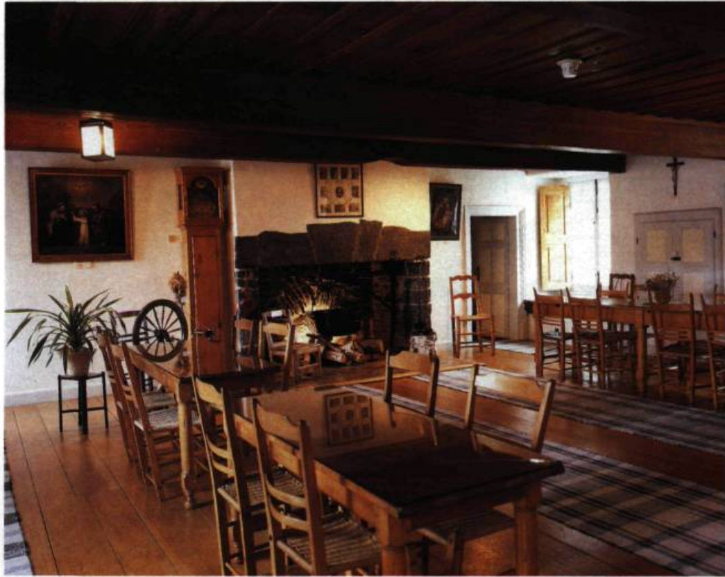
Dans la salle commune, à la fois réfectoire et salle de réception, les nombreux meubles de pin contribuent à créer une atmosphère chaleureuse où le temps semble s'être arrêté.

Place Dublin, à la Pointe-Saint-Charles, dans un environnement des plus urbains, s'élève un imposant bâtiment de pierres des champs noyées dans un épais mortier. Vestige d'une autre époque, la Maison Saint-Gabriel 1 est l'une des rares constructions qui témoignent de l'architecture montréalaise de la fin du XVII e siècle. Érigée vers 1668 par François LeBer et acquise peu de temps après par Marguerite Bourgeoys, fondatrice de la congrégation de Notre-Dame, cette maison de ferme, reconstruite en 1698 après un incendie, constitue aujourd'hui un site unique.