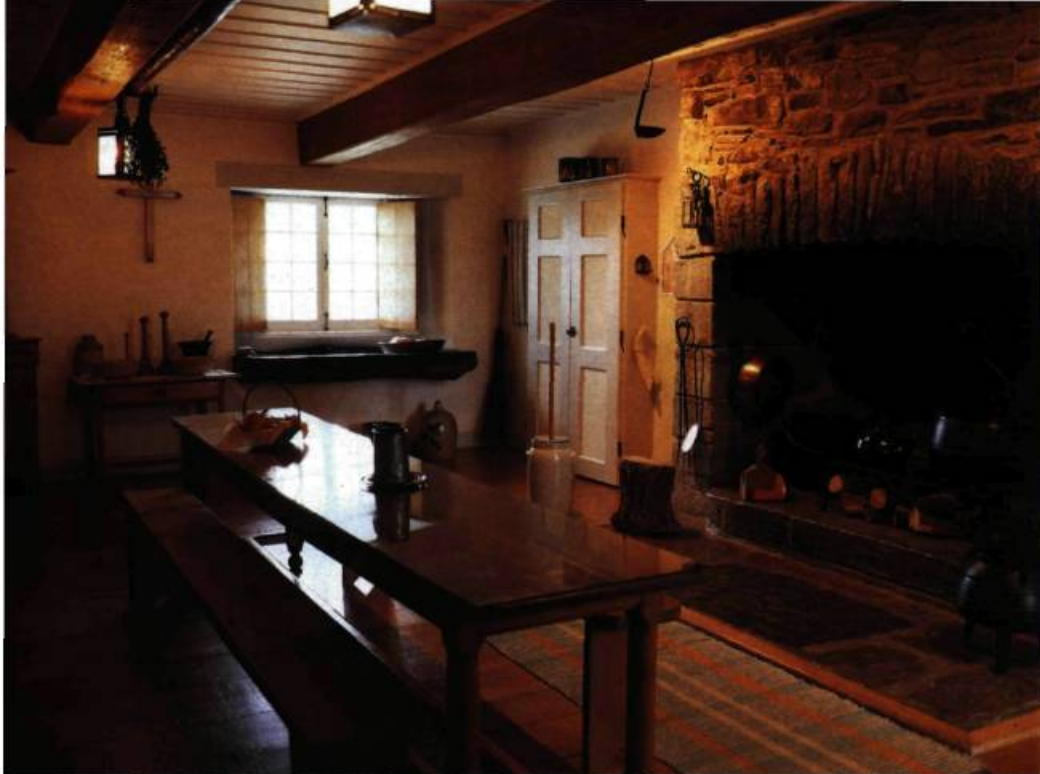
Dans la cuisine trône une grande cheminée agrémentée de tous les accessoires d'usage. Sous la fenêtre, un évier en pierre calcaire.