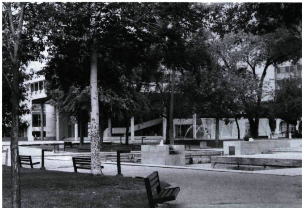
Certains parcs rehaussent la valeur architecturale et patrimoniale des bâtiments qu'ils avoisinent. Le parc Champlain, à Trois-Rivières (Georges Daudelin, arch. paysagiste, 1974).

Ouverte sur l'écologie et l'urbanisme, sensible aux besoins humains, l'architecture de paysage élargit constamment son domaine d'action.