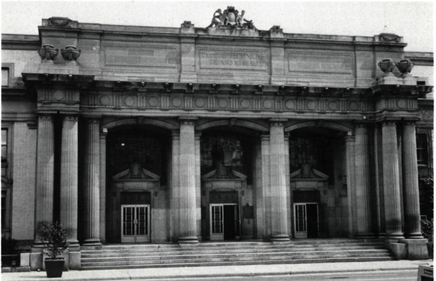
L'École technique de Montréal, réalisée entre 1909 et 1911 par J.S. Archibald, M. Perrault et A. Venne.

On comprend dès lors pourquoi les meilleurs éléments demeuraient à l'École au-delà du diplôme, et pourquoi leur oeuvre s'est située presque sans exception dans l'architecture institutionnelle et dans la résidence bourgeoise. Ce n'est qu'à partir des années trente, avec des conditions démographiques et économiques nouvelles, la chute de la III e République, les destructions de la Deuxième