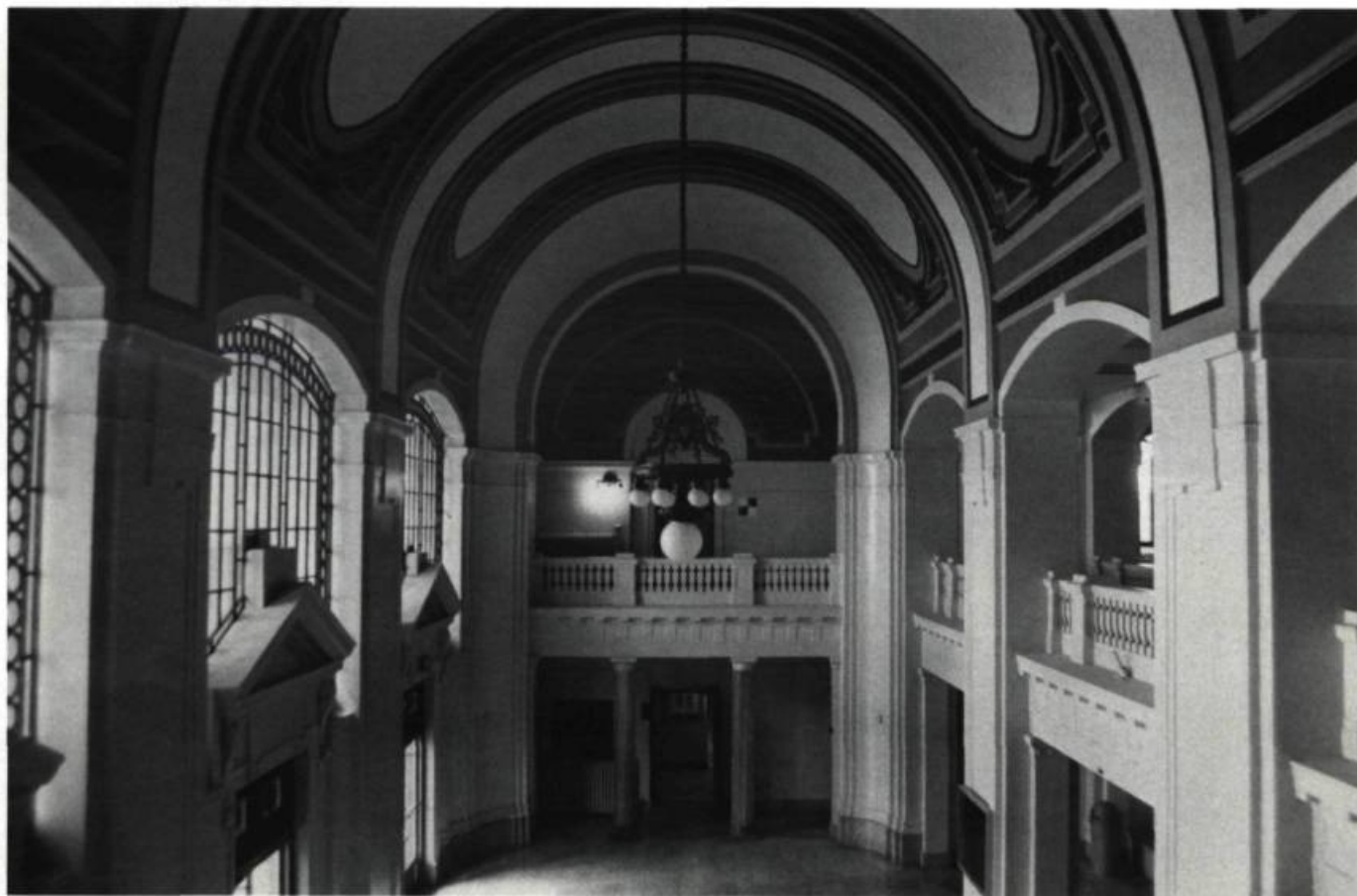
Le hall de l'École technique de Montréal.

rer aussi bien le corps que l'esprit de l'étudiant à ses futures conditions de travail. Cet édifice, bien que remanié et légèrement amputé, mérite d'être conservé dans son intégralité. Outre le fait que les ateliers comprennent d'impressionnants espaces à structure métallique apparente et de larges verrières, ils sont essentiels pour comprendre la dialectique du corps et de l'esprit, du manuel et du cérébral qui était à la base du programme d'enseignement comme du design de l'édifice. ■