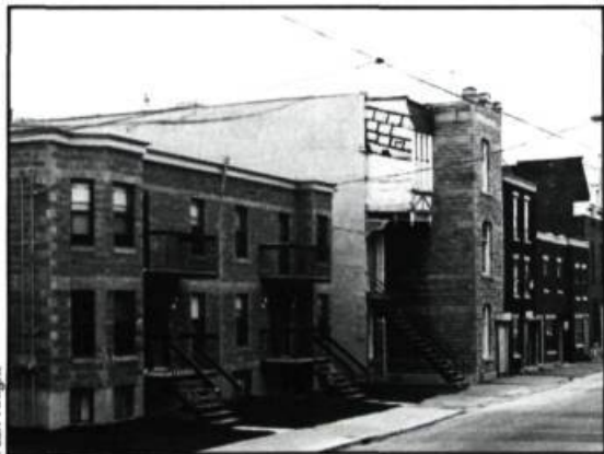
Projet de la Société municipale d'habitation de Montréal, sur la rue de la Visitation. Conçu en 1980 et mis en chantier en 1982.

complissent également un excellent travail de reprise en main des quartiers victoriens. Dans ce cas-ci également, ce sont les habitants actuels de ces quartiers qui en profitent et non les banlieusards tant attendus.