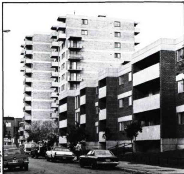
On constate une évolution dans l'attitude des architectes-conseils du Service de l'habitation face aux projets dans les vieux quartiers montréalais. En premier plan, les «Habitations Saint-André». Un projet de 143 logements conçu en 1969 par les architectes-conseils Bleyer & Charlap et mis en chantier en 1972. À l'arrière-plan, le projet Sainte-Catherine d'Alexandrie: 110 logements et des locaux communautaires (au rez-de-chaussée) destinés à des personnes âgées dites «autonomes». (Conçu en 1971 par les architectes associés Beauvais Lusignan, Bédard et Charbonneau, et mis en chantier en 1974.)

On s'est déjà mis à la tâche. La revitalisation des artères commerciales montréalaises est bien visible (même si ses formes font l'objet de maintes critiques)(6). La réouverture des anciens marchés et la rénovation de ceux existants, l'embellissement des rues, le réaménagement des parcs et des places sont d'autres reflets de nouvelles politiques pro-urbaines visant à améliorer la salubrité de ces quartiers, à les doter de meilleurs services publics et à les rendre plus attractifs.