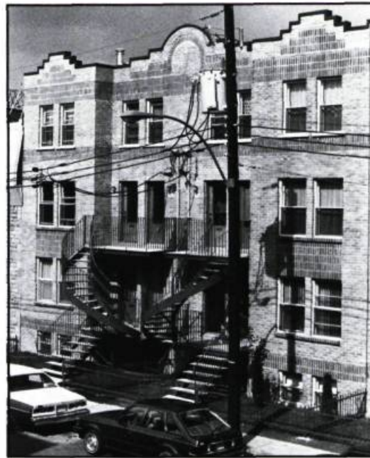
Le gabarit des maisons avec façade sur la rue se voit de plus en plus respecté dans les projets d'habitation à Montréal. Ci-haut: une insertion sur la rue Saint-André à Montréal. (Blanchi & Voisard, architectes)