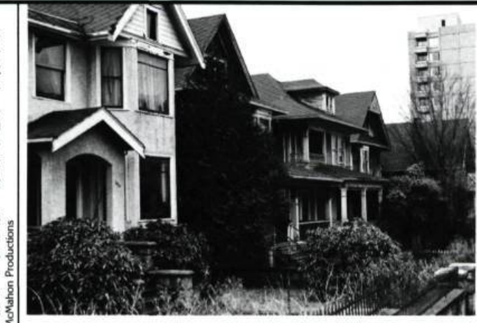
L'îlot recèle une grande variété de styles et de techniques de construction que le nouvel aménagement saura mettre en valeur.

L'étude a recommandé une démarche inattendue. Premièrement, elle mit de l'avant la transformation de l'îlot en parc tout en conservant la plupart de ses bâtiments. Le centre d'intérêt serait les composantes de l'îlot, un espace doté d'une ruelle, de garages, hangars, clô-