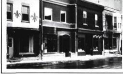
L'idéologie de la réappropriation.

L'aspect formel du patrimoine est important mais la problématique de sa conservation, de son utilisation et de sa mise en valeur ne saurait se ramener à ce seul aspect. Prenons un exemple concret, signe d'une attitude très répandue: celui de la cour Sainte-Famille (3431-3457, rue Sainte-Famille à Montréal). Dans ce cas d'intégration d'un bâtiment d'habitation sur des lots où se juxtaposaient autrefois duplex et triplex, l'architecte a pris le parti de développer un complexe résidentiel dont la densité et la variété des unités de logement correspondent davantage à la réalité vécue dans ce secteur que l'ancienne topologie construite, tout en présentant une façade s'inscrivant avec sympathie dans la continuité architecturale de la rue Sainte-Famille. Pourtant dans un Bilan de l'intégration au