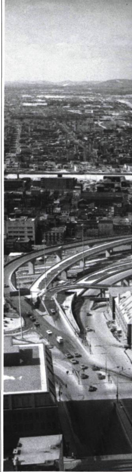
La bien nommée «autoroute des fonctionnaires» à Québec de cette foi naïve dans le progrès technologique.

Ainsi à Montréal, le règlement de zonage dit du Flanc sud du Mont-Royal (no 3722), préparé au début des années 1960 par ces mêmes professionnels du Service d'urbanisme, reflète exactement cette attitude. Si ce règlement, touchant le secteur délimité par le Chemin de la Côte-des-Neiges, l'avenue des Pins et les rues McTavish et Sherbrooke, se voulait restrictif pour protéger la vue