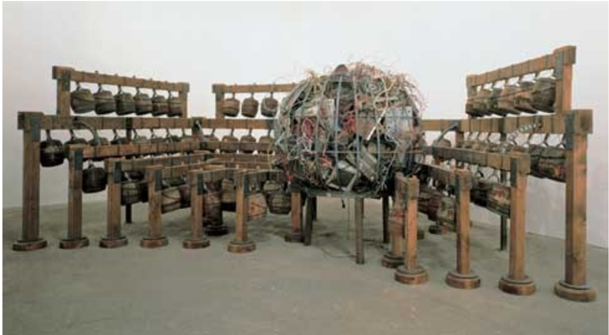
Figure 4 : Chen Zhen, Daily incantations , exposition Chen Zhen , CIAC-Centre international d'art contemporain de Montréal, Montréal