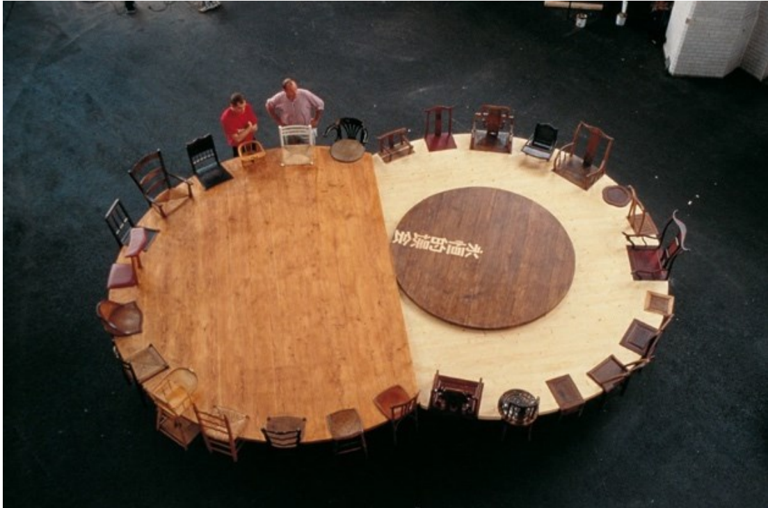
Figure 2 : Chen Zhen, Round Table - Side by Side , exposition l'Autre , Hall Tony Garnier, Lyon