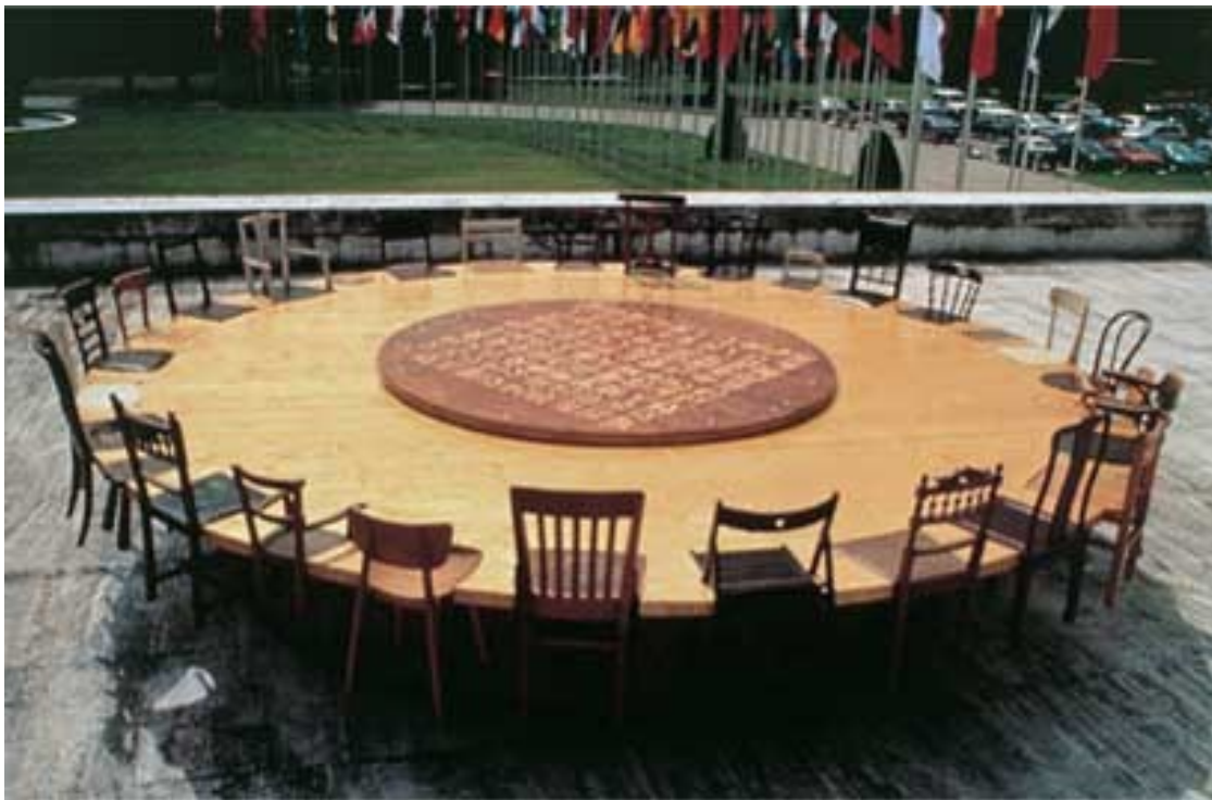
Figure 1 : Chen Zhen, Round Table , exposition Dialogue de Paix , ONU, Genève

de réviser la définition des "Autres" » 19 . Tout le monde dans ce monde de Chen Zhen est l'autre, y compris lui-même ; tout comme l'idée bouddhiste de Anatman (tous les dharmas sont non-soi). Fait intéressant, Chen Zhen a également douté dans sa théorie Transexperience : « Curieusement, les artistes non occidentaux, qui font partie des "autres", ne se demandent jamais comment définir à leur tour ceux qui les ont ainsi désignés ». Oui, la plupart des artistes contemporains chinois qui sont entrés dans les pays occidentaux dans les années 1980 sont habitués à se considérer comme des « autres ». Ils mettent encore l'accent sur leur identité chinoise, en utilisant des œuvres exotiques pour explorer l'hégémonie culturelle mondiale, le colonialisme, les conflits raciaux et d'autres problèmes par le biais d'euphémismes ou de métaphores. Ils croient tous fermement qu'« il n'y a pas de poisson lorsque l'eau est trop claire » ( Shui ze qing ze wu yu 水至清则无鱼), et ils aiment « Fais du bruit à l'Est et attaque à l'Ouest » ( Sheng dong ji xi 声东击西). Ils sentent également que le monde est « Je suis en toi et tu es en moi » ( wo zhong you ni, ni zhong you wo 我中有你, 你中有我), et tout le monde est un autre naturel.