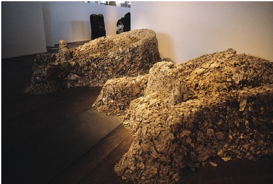
Figure 5 : Huang Yongping, Reptiles , exposition Magiciens de la Terre , Centre Pompidou, Paris