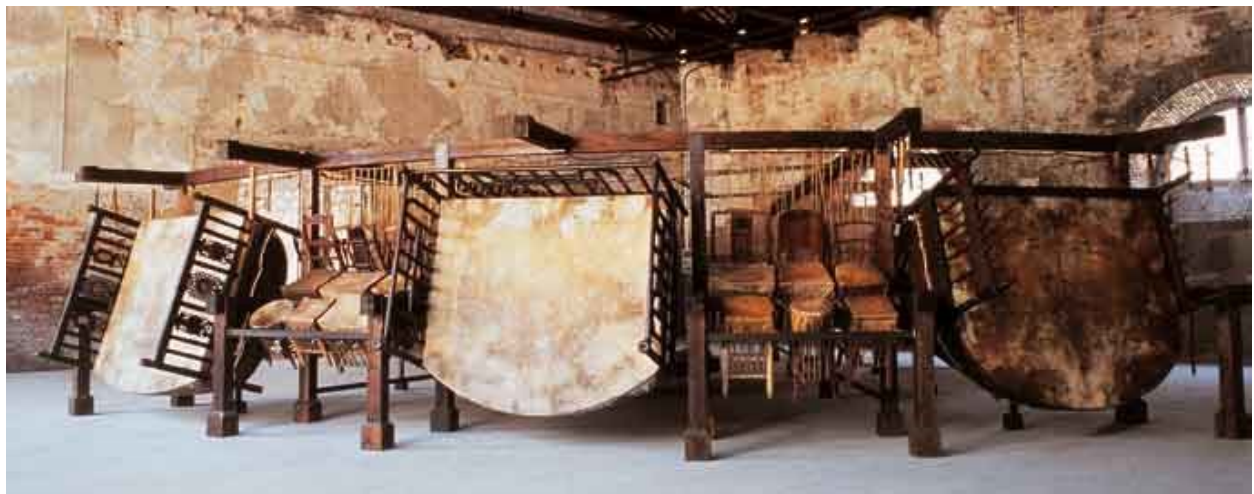
Figure 3 : Chen Zhen, Jue Chang/Fifty Strokes to Each , exposition Chen Zhen , Musée des beaux-arts de Tel Aviv, Tel Aviv