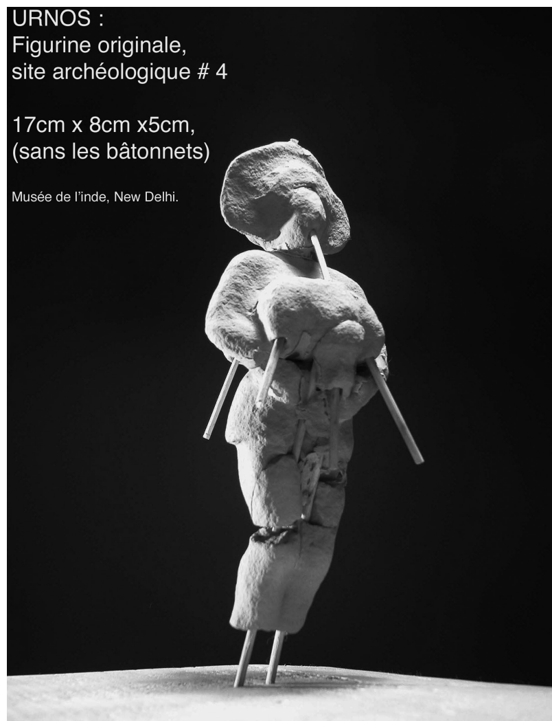
FIGURE 1 Figurine originale, site archéologique n° 4. Musée de l'Inde, New Delhi.

8. Dans une discussion sur l'accueil des publics et sur les lieux dans lesquels cet accueil se déroule en contexte de médiation, l'auteur Serge Saada souligne « la volonté d'immerger rapidement les spectateurs à l'ensemble [...] de la représentation. D'une certaine façon, en imaginant un autre accueil des publics, [certains]