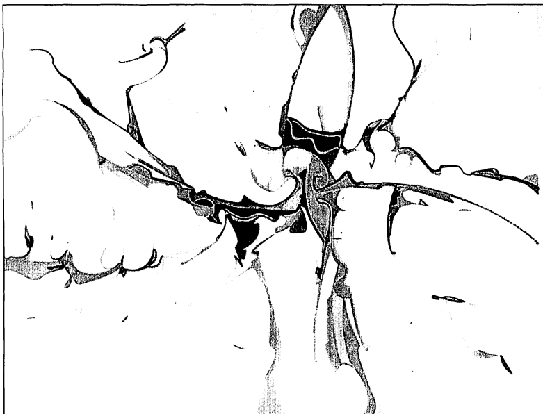
All what he made, Alex Janvier

De façon subjective, il trace un schéma global de ces idées. Cette façon de procéder rend la forme claire et les gestes musicaux bien définis. Le schéma permet donc de distinguer les éléments marquants et dominants de l'œuvre ou d'un passage travaillé dans celle-ci. Voici un exemple concret tiré des notes personnelles du compositeur pour la réalisation du portrait d'Alex Janvier.