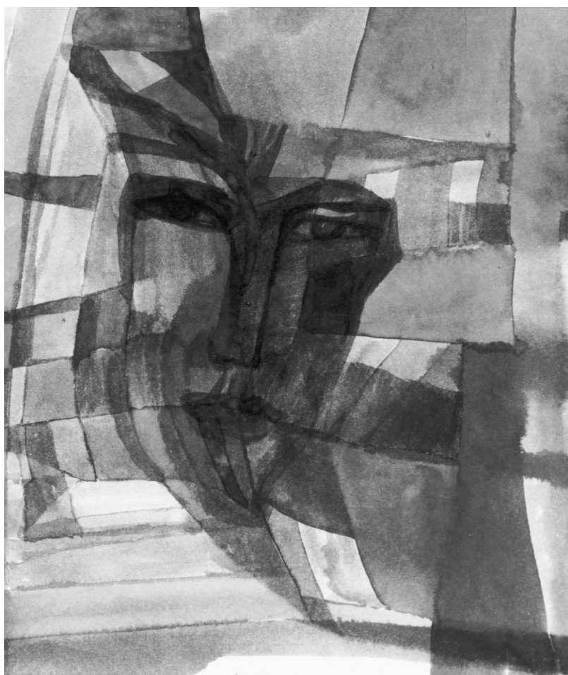
Photo tirée de la production Climats réalisée par Suzanne Gervais, produite par Pierre Moretti. © Office national du film du Canada, 1974. Tous droits réservés.

l'a dit, selon le type d'animation, de mode de fabrication et de liaison des images, le monteur est appelé à intervenir dès la préparation du film. Ensuite, parce que dans la majeure partie de sa production, le cinéma d'animation rejoue l'écriture filmique et recourt au découpage. De plus, il n'hésite pas à intégrer à sa diégèse cette énergie proprement mécanique du montage cinématographique. Térésa Faucon, dans un article surprenant 26 , revient sur une série de cartoons produits par