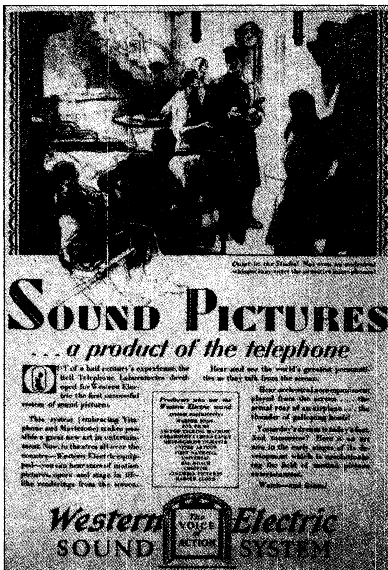
Illustration 4. Publicité de la Western Electric, provenant de Life (± 1929)

nouvelle technologie audiovisuelle comme une simple extension de la téléphonie.