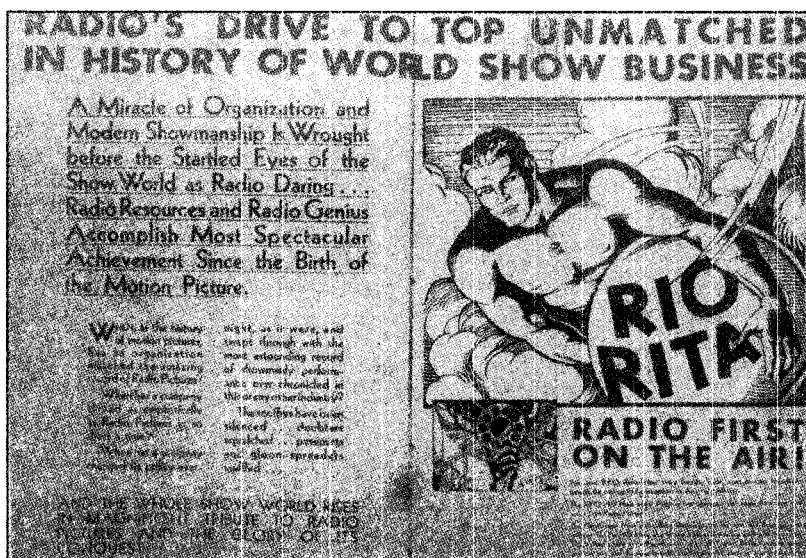
Illustration 6. Publicité de la RKO, provenant de Variety (18 juin 1930), p. 34-35

« multimédia », étant donné le caractère désormais stable des médias en question. Si l'intermédialité suppose une forme prise entre plusieurs médias, une forme dont l'identité reste en suspens, le multimédia dépend de l'existence de médias assez confiants en leur identité respective pour oser les combinaisons les plus outrées.