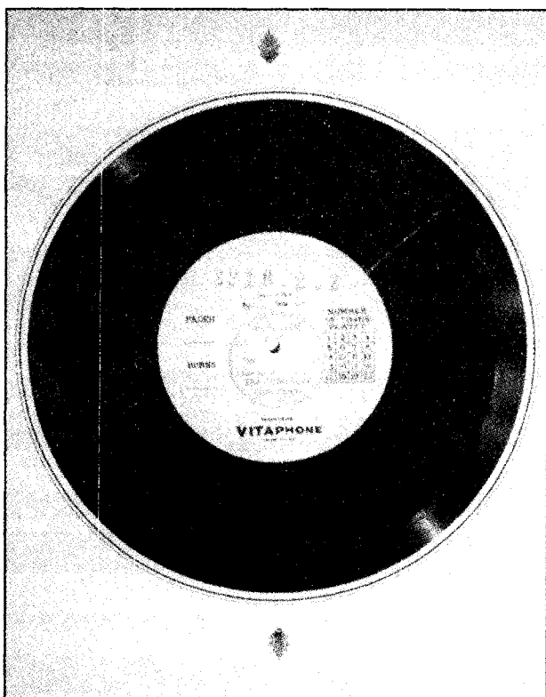
Illustration 1. Disque Vitaphone de la piste sonore du film The Jazz Singer (Warner, 1927)

d'abord un disque et relève donc de la phonographie. C'est justement ce que notait la critique de l'époque. Pour l'un des commentateurs, « Le film est un simple enregistrement de Jolson sur disque Vitaphone élargi » (Spargo). « Vous voulez ma définition d'un film parlant?, demande un deuxième, c'est un disque phonographique fortement amplifié » (Ennis, p. 43).