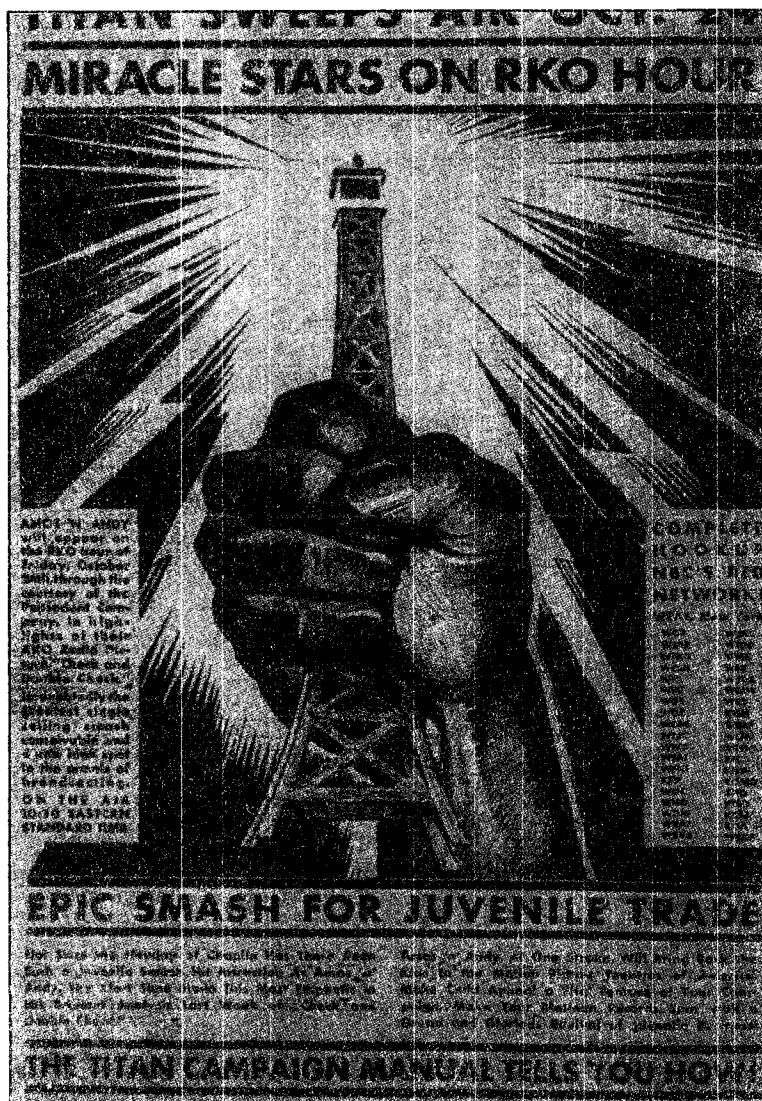
Illustration 5. Publicité de la RKO, provenant de Variety (23 octobre 1929), p. 34-35

relativement stable que, depuis les années trente, nous appelons à nouveau « le cinéma » tout court. Une fois reconstitué, redéfini, rebaptisé, c'est-à-dire sorti de l'intermédialité, le cinéma gagnera l'indépendance qui lui permettra par la suite d'être souvent mêlé à des représentations qu'on a raison de qualifier de