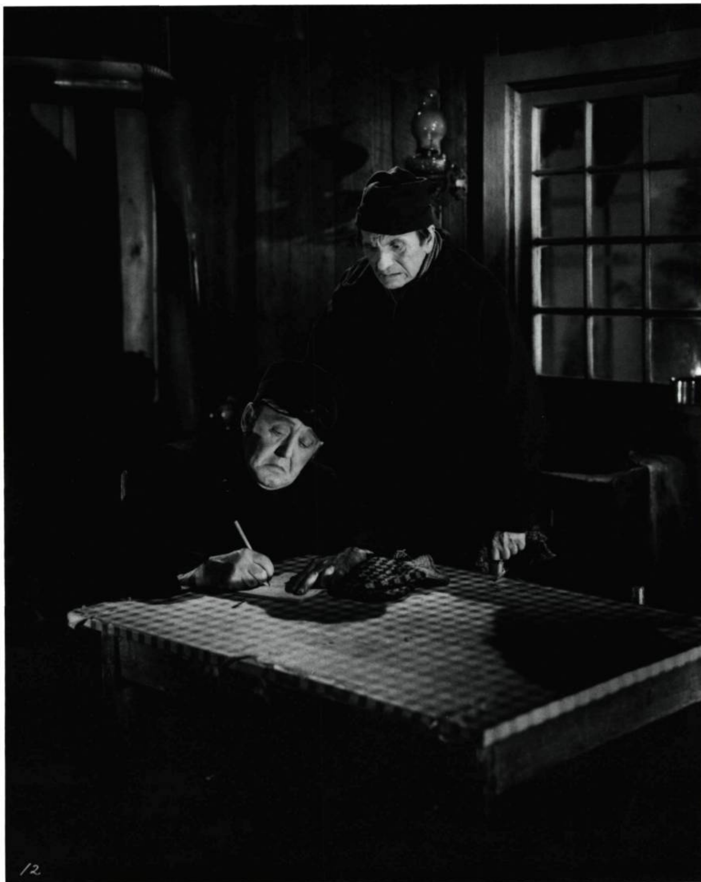
Eugène Daignault et Hector Charland: UN HOMME ET SON PÉCHÉ 1948