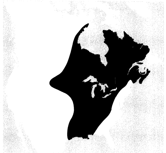
L'Amérique française avant le traité d'Utrecht, 1713