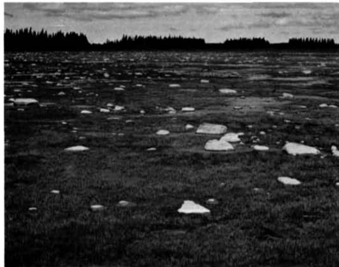
Photo 12 Blocs glaciels abandonnés récemment dans un schorre à scirpes près de Fort Rupert (78°48' W ; 51°28' N). 24.6.75. Ice-drifted boulders at the surface of a Scirpus tidal marsh near Fort Rupert (78°48' W ; 51°28' N). 6.24.75.