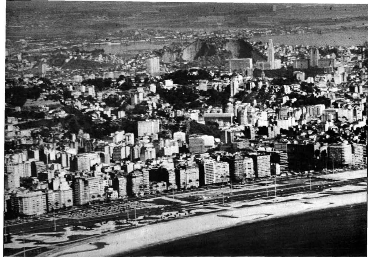
Photo 2 Le front de mer de Praia Flamengo, entre le centre-ville de Rio de Janeiro et le noyau de Copacabana. Des immeubles en propriété horizontale et quelques palaces ont remplacé les hôtels particuliers de la fin du siècle dernier. Une fois récupérée l'emprise nécessaire à l'autoroute de ceinture, la plage a été reconstruite. À l'arrière-plan, l'un des premiers morros, occupés par des favelas, au début des années 1950, laisse voir de profondes excavations, signe évident de sa disparition prochaine.

ment impérieuse. 9 Le cas du Brésil est particulièrement intéressant en ce sens que les inégales aptitudes du milieu naturel interfèrent encore avec l'inégal aboutissement des cycles économiques: les cultures sont pratiquées aux dépens des forêts susceptibles de brûler et l'élevage extensif se retrouve partout ailleurs. Il faut donc reconnaître l'étroitesse des liens qui unissent conditions bio-climatiques et topographiques, la régularité des vents et la netteté des accidents topographiques facilitant l'identification d'aires écologiques bien délimitées. Parmi les divers découpages du Brésil sur la base de l' Atlas Nacional , seules les régions physiographiques peuvent être considérées comme des régions géographiques élémentaires, aucun des 18 États qui constituent la fédération n'ayant valeur de région.