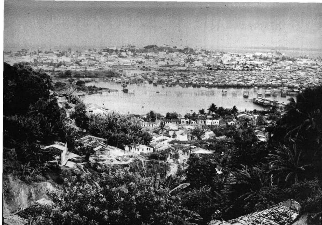
Photo 1 San Salvador de Bahia, métropole régionale du Reconcavo et de son arrière-pays, donne asile depuis quelques années à des masses d'immigrants, chassés de l'intérieur soit par la sécheresse, soit par la mévente, ou tout simplement en quête d'une « vitrine ». A quelques kilomètres du centre-ville, l'un des beaux quartiers résidentiels occupe une colline entre la baie de Todos os Santos et une lagune, espace non réclamé peu à peu envahi par des agrégats d'habitations sommaires montées sur pilotis : les invasões.

de la production, c'est-à-dire l'offre, autant d'ailleurs que par les facteurs économiques qui, de leur côté, suscitaient la demande. C'est du moins l'interprétation dynamique qu'oppose Celso Furtado à la théorie classique de la succession des cycles, laquelle ne prend guère appui que sur une apparente détérioration de l'offre, alors que l'économie brésilienne, à peine née, s'insérait déjà dans le jeu des spéculations internationales.