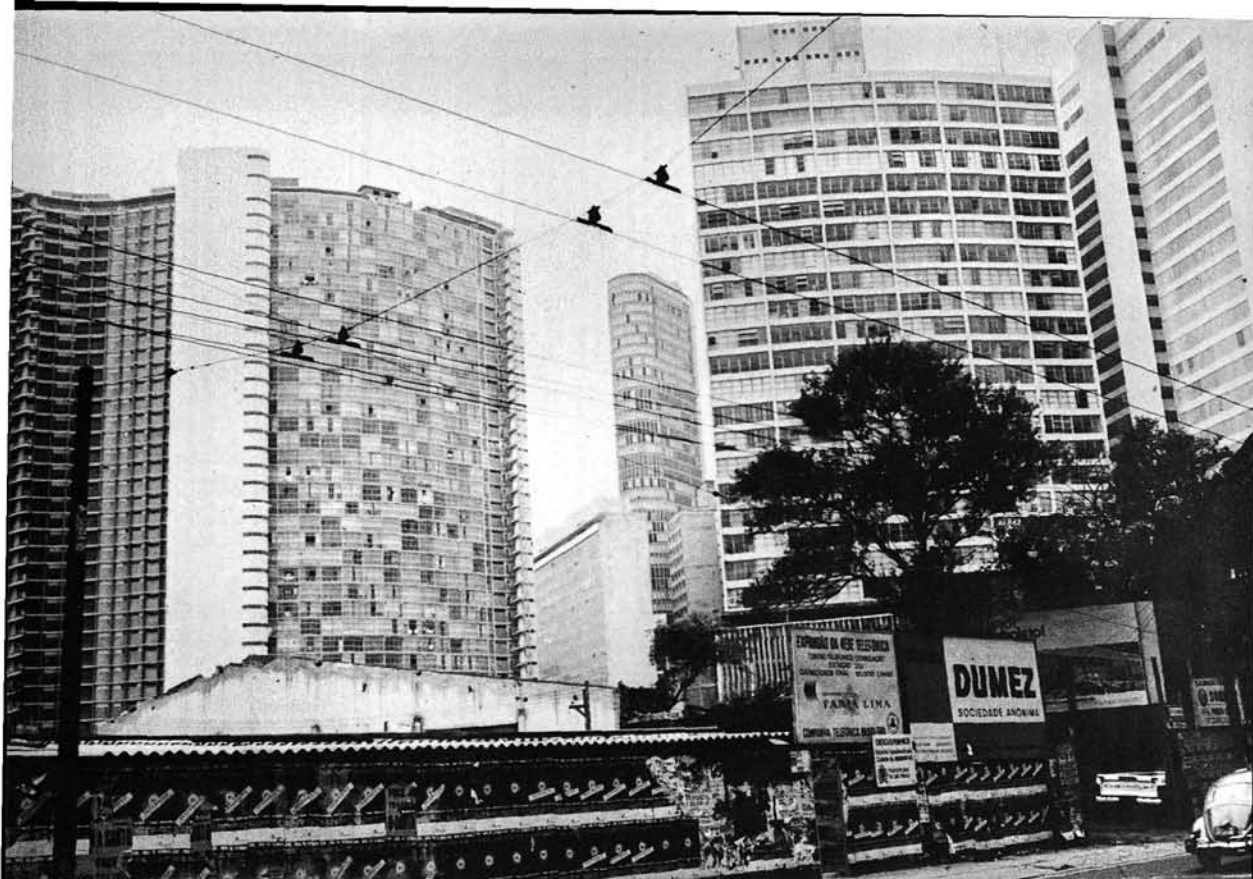
Photo 4 Les édifices en hauteur surgissent de partout à São Paulo, cœur industriel du Brésil, l'une des villes les plus dynamiques du monde. Leur rythme de croissance n'a d'égal que le souci d'originalité et d'esthétique urbaine qu'on y décèle et qu'on ne retrouve guère qu'à Caracas.

La méthode reste donc fidèle au double but défini au début de cette troisième partie: l'identification à travers tout le territoire brésilien des principaux centres polarisateurs et la définition de leur position hiérarchique selon leur pouvoir de polarisation, puis la délimitation de leur zone d'influence respective. Cependant, s'il est intéressant de connaître les points actuels de concentration des équipements polarisateurs, le problème de la description du découpage actuel reste entier tant que le rôle effectif de ces centres comme éléments d'attraction de l'espace extérieur n'a pu être mesuré, par suite de difficultés de documentation. 23