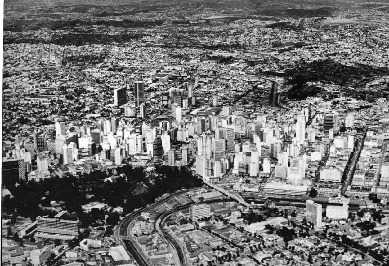
Photo 3 Belo Horizonte, métropole régionale du Minas Gerais, groupe plus d'un million d'habitants et arbore maintenant un impressionnant faisceau de gratte-ciels. Au premier plan, le parc central qui, fort heureusement, a échappé à la fièvre de la construction, ceinturé d'une autoroute de dégagement.

Le paysage original du plateau pauliste caractérisé par la Terra rossa (produit de la décomposition des trapps basaltiques) est aujourd'hui fragmenté en de multiples unités. 20 À l'orientation axiale des interfluvés caféiers et des valles occupés par le coton, l'embouche, le riz et les cultures vivrières et pénétrés par les voies ferrées, à cette digitation initiale orientée vers l'ouest, se superpose aujourd'hui perpendiculairement un écheveau d'interrelations qui correspondent à la mise en place d'une vaste organisation régionale. Dans un contexte aussi mobile, aussi dynamique que celui-ci, il importe cependant de prévoir une révision permanente des critères de régionalisation: tâche délicate, s'il en est, d'autant plus qu'une première confrontation oppose les régions vieilles et les régions neuves.