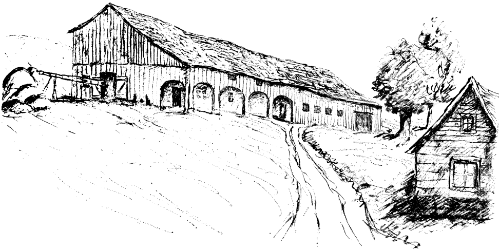
(Dessin de Pierre DEFFONTAINES.)

Figure 6 Grange-étable à toit dissymétrique, prolongé sur le côté sud par un hangar-portique ; une porte de l'étable est sous la grange, une autre est à côté de la grange ; à gauche, benne suspendue sur rails, pour le transport des fumiers ; toit en bardeaux de cèdre ; à droite, habitation en pièces sur pièces (à Sainte-Anne-de-Beaupré).