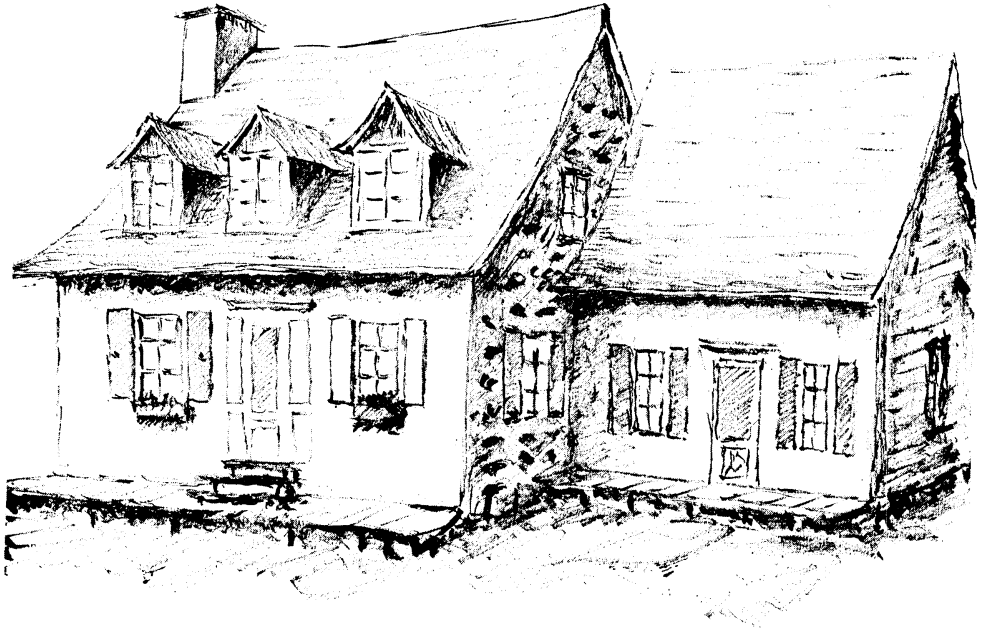
(Dessin de Pierre DEFFONTAINES.)

Figure 4 À gauche, maison en pierres de champs, sans solage, avec cheminée dans le pignon gauche, au sud-ouest; on y a ajouté récemment un petit perron-trottoir avec escalier; c'est la maison d'hiver; mais à droite, à côté, on a construit une maison d'été en planches sans cheminée, mais avec un petit solage (à Saint-Nicolas).