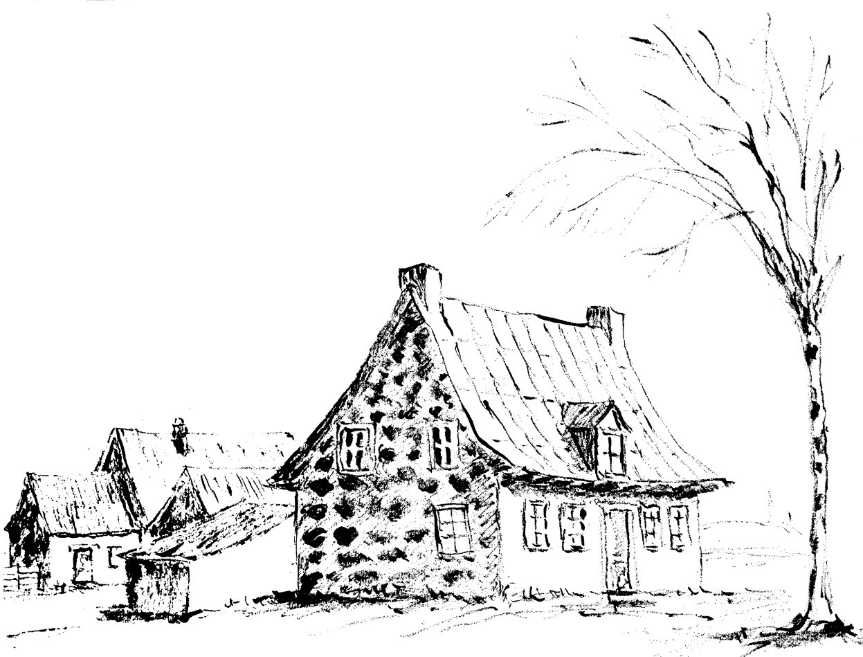
(Dessin de Pierre DEFFONTAINES.)

Figure 1 Logis en pierre de champs, directement en contact avec le sol, sans solage; deux grandes cheminées, ménagées dans les pignons de pierre. Toit haut depuis peu couvert en zinc, avec commencement de courbure du larmier (à Saint-Prosper, à l'est de Shawinigan).