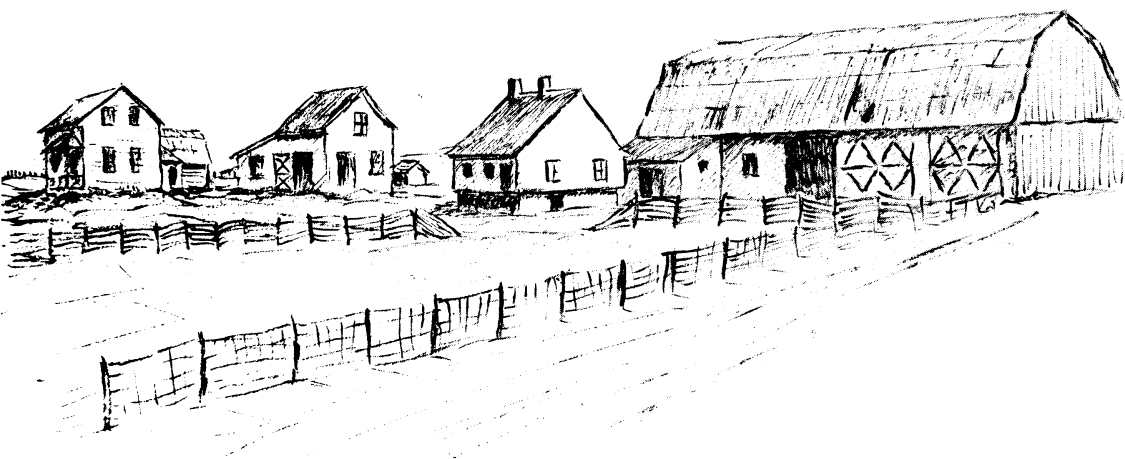
Figure 7 Ferme canadienne à multiples bâtiments avec grange octogonale, munie de montée de grange et avec étable supplémentaire adjacente. Habitation en pièces sur pièces à cheminée centrale (à Saint-Anselme).