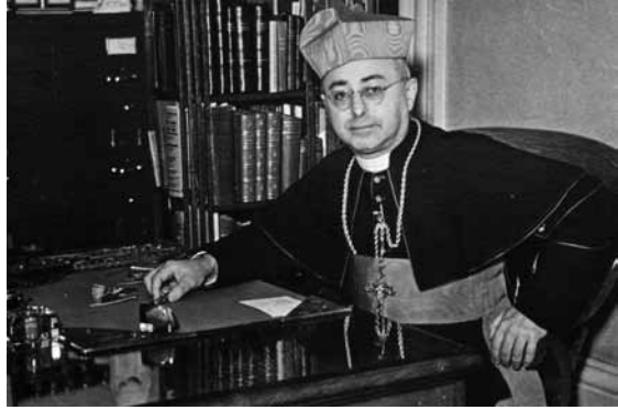
Le Cardinal Jean-Marie Rodrigue Villeneuve o.m.i. (1883-1947), archevêque de Québec (1931-1947), membre du Comité catholique du Conseil de l'Instruction publique.

Archives des Dominicaines Missionnaires Adoratrices, Québec.