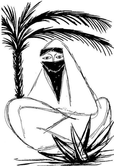
Illustration de Charles Daudelin au chapitre intitulé « Un monde en mouvement: le monde arabe ».