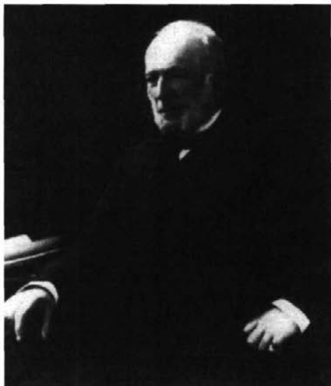
Sir James MacPherson Le Moine (1825-1912), homme de lettres et historien québécois.

En adoptant l'attitude qui vient d'être décrite, Le Moine trahit encore ses appartenances en ce qu'il partage avec ses compatriotes francophones cette sorte de complexe d'infériorité collectif, voire de complexe de culpabilité propre aux colonisés, qui les incite à se préoccuper de l'opinion que les colonisateurs se font d'eux et à tenter de se revaloriser à leurs yeux par la reconstitution du passé. Sait-on assez que la victoire de Châteauguay a marqué le début d'un mouvement patriotique en ce qu'elle a permis aux historiens de montrer que les vaincus de 1759 et de 1760 peuvent être vainqueurs sur les champs de bataille ? D'où l'importance de Salaberry dans l'iconographie nationale 53 .