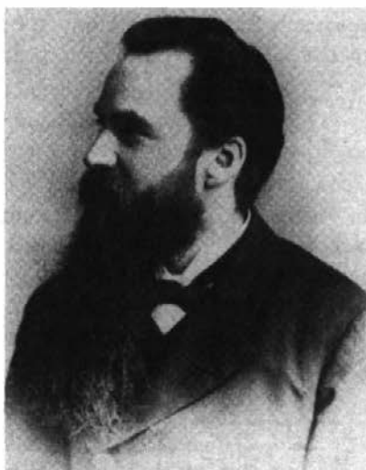
Guillaume Couture en 1888. (Encyclopédie de la musique au Canada)

Contrairement à Montréal, je n'ai rencontré à Paris que des cœurs sympathiques. À Montréal, on me détestait. Singulier contraste. Si j'étais riche, le