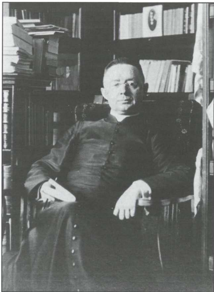
L'historien dans sa chambre au presbytère de Saint-Enfant-Jésus du Mile End, Montréal, vers 1920 Fonds Lionel-Groulx Centre de recherche Lionel-Groulx