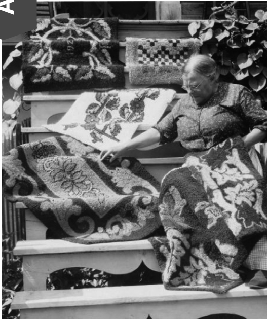
Une dame avec l'étalage de ses tapis, vers 1930. Fonds de L'Action catholique, BAnQ. (P428, S3, SS1, D4, P17). ( https://numerique.banq.qc.ca/patrimoine/details/52327/2991594?docsearchtext=tapis )