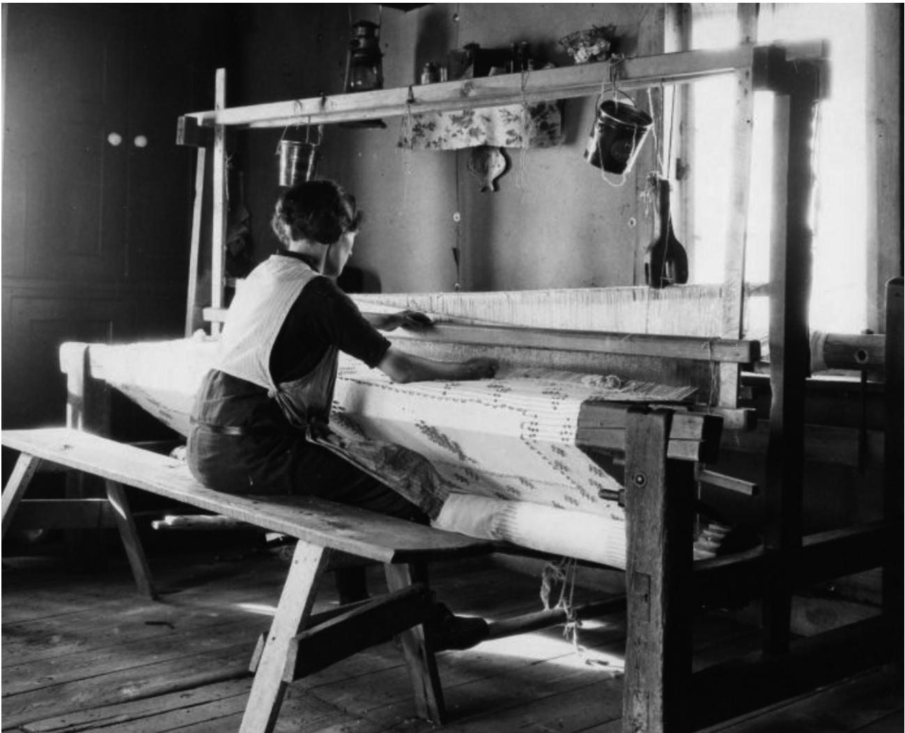
Page couverture de l'ouvrage d'Oscar-A. Bériau, La teinturerie domestique , Québec, Ministère de l'Agriculture, 1932.

Gauvreau dirige une petite équipe qui travaille à identifier les artisans et artisanes de la province. Ses enquêtes l'amènent à déposer en 1939 un Rapport général sur l'artisanat . Grand défenseur du mariage entre l'artisanat et le développement économique régional, Gauvreau défend une production qui mêle tradition et modernité. Il encourage la diffusion de modèles et de patrons afin d'encadrer la production, notamment sur le plan esthétique.