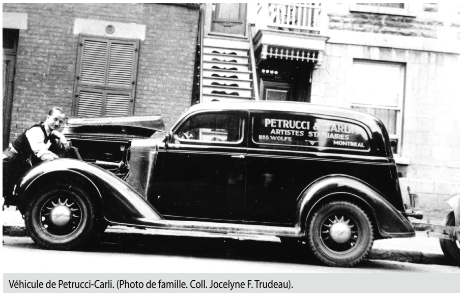
Véhicule de Petrucci-Carli.

américains, vend ses parts des entreprises et fait le projet de déménager en Floride, avec femme et enfants. Le style Art déco est en plein essor aux États-