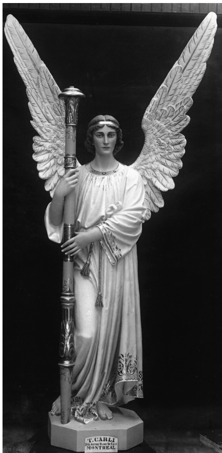
Ange par T. Carli au fini « riche ». (Négatif corporatif sur verre.).

américains, vend ses parts des entreprises et fait le projet de déménager en Floride, avec femme et enfants. Le style Art déco est en plein essor aux États-