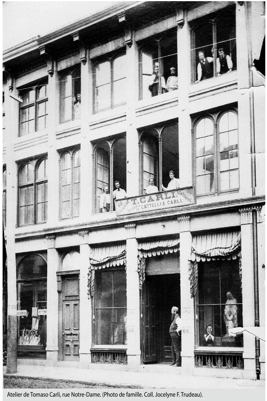
Atelier de Tomaso Carli, rue Notre-Dame.

statues offertes aux nouvelles paroisses. La production augmentant, on s'organise et on s'associe. Des noms de compagnies sont notés au registre des entreprises : Baccarini & Filippi, Catelli & Giannotti, E. Dini & Co, Giovannetti & Buonaccorsi. Les ateliers sont situés pour Baccarini rue Gosford au Champ-de-Mars et pour Catelli rue Notre-Dame à Montréal.