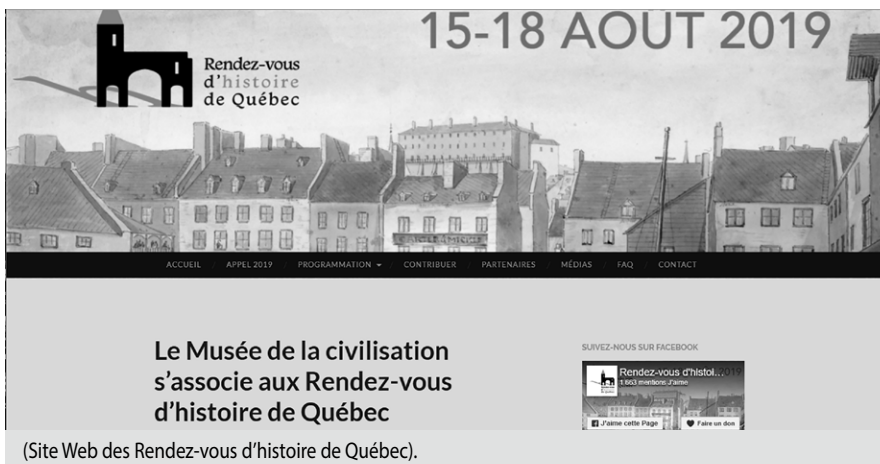
(Site Web des Rendez-vous d'histoire de Québec).