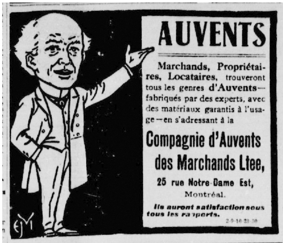
Edmond-Joseph Massicotte (1875-1929), publicité pour la Compagnie d'auvents des marchands Limitée de Montréal, tirée de La Patrie (1879-1957) du samedi le 2 juin 1909, n° 83, p. 6.

cités rigolotes, pour le compte de la Compagnie d'auvents des marchands Limitée, spécialisée en produits de plein air. En 1909, plusieurs annonces montrent entre autres des caricatures