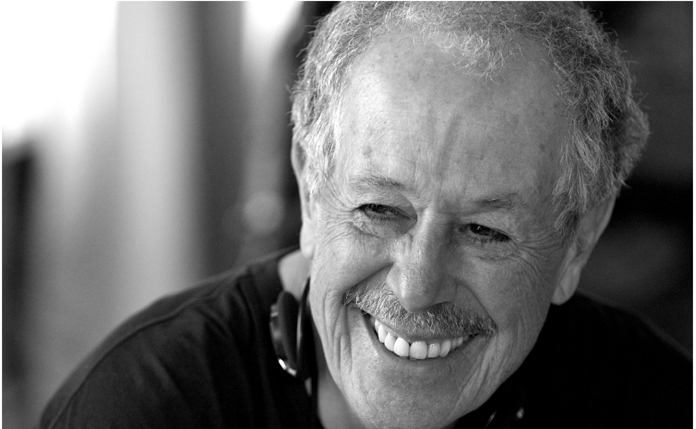
Denys Arcand

S i les Pierre Perrault, Michel Brault, Claude Jutra, Gilles Groulx et Jean-Claude Labrecque peuvent être considérés comme les pères fondateurs du cinéma québécois, Denys Arcand en est le grand frère de toutes les audaces. Il a ouvert la voie cinématographique qui a mené à Cannes et Hollywood toute une génération de jeunes cinéastes : Jean-Marc Vallée, Denis Villeneuve, Xavier Dolan. Le temps d'un repas au Musée national des beaux-arts du Québec, le cinéaste se dévoile avec générosité. Cochez oui. Cochez non.