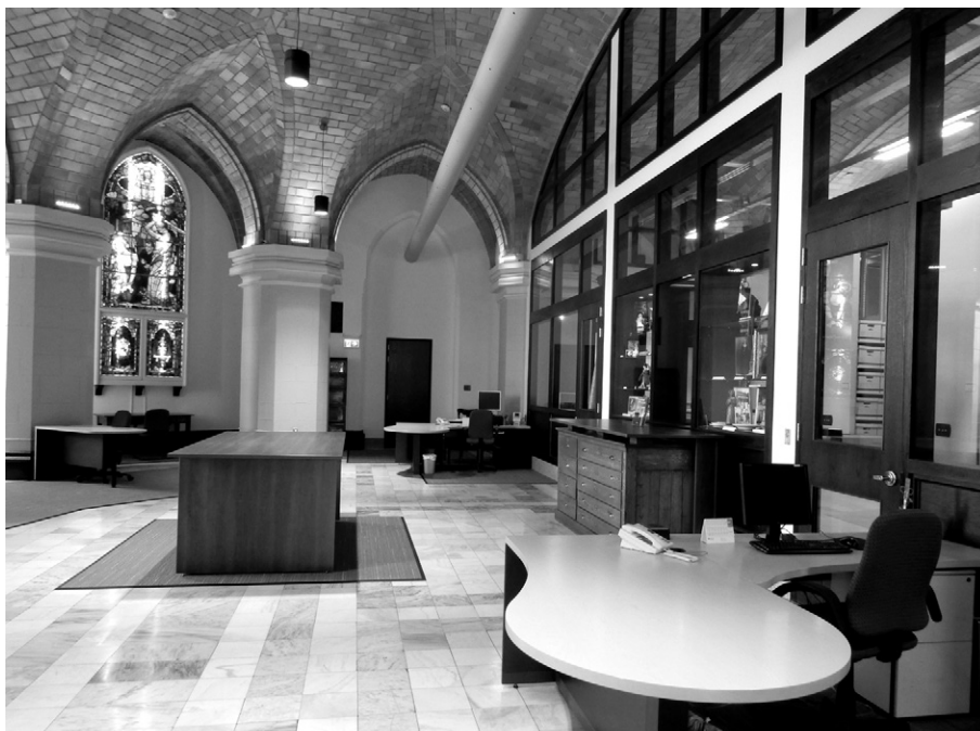
Vue partielle de l'aménagement. Au premier plan, un bureau du personnel, situé à côté de la porte d'accès à la voûte qui est vitrée. Au centre de la pièce, un meuble permettant la consultation de grands formats alors que les postes de travail individuels sont situés le long de l'abside, près des vitraux. Centre d'archives Mgr-Antoine-Racine.

Un fait demeure, il faut souligner le dévouement de très nombreux religieux et laïcs qui, d'hier à aujourd'hui, travaillent souvent dans l'ombre et se dévouent corps et âme à la conservation et à la transmission de notre si précieux patrimoine archivistique religieux.