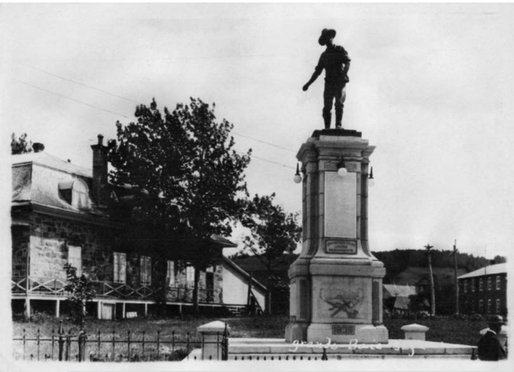
Le monument des Vingt-et-Un est inauguré le 29 juin 1924. L'œuvre est sculptée par Anselme Delwaide et Rodolphe Goffin sur des plans d'Armand Gravel. La statue du semeur est ajoutée vers 1929 par Carli et Petrucci de Montréal. Photo : J.E. Chabot, vers 1930. (Bibliothèque et Archives nationales du Québec).

Mais pourquoi cette fête? Nous savons que le jésuite Jean de Quen se rendit au lac Piékouagami dès 1647 et qu'il y retourna en mission ensuite régulièrement. Alors pourquoi faire débiter l'histoire du Saguenay-Lac-Saint-Jean en 1838? L'explication est simple : toute la région comprise entre Sept-Îles et La Malbaie et bornée au nord par le bassin hydrographique du Saguenay-Lac-Saint-Jean était fermée à la colonisation. Le Domaine du roi, ainsi nommé en 1652, était réservé à des intérêts privés qui louaient aux autorités coloniales le privilège d'en faire l'exploitation, principalement pour la traite des fourrures et les pêcheries. Cette situation change au XIX e siècle. La Chambre d'assemblée du Bas-Canada mandate, en 1828, une commission pour évaluer le potentiel du Saguenay-Lac-Saint-Jean comme territoire de colonisation. Malgré un rapport favorable et un intérêt de la population de Charlevoix pour la région, le projet reste lettre morte.