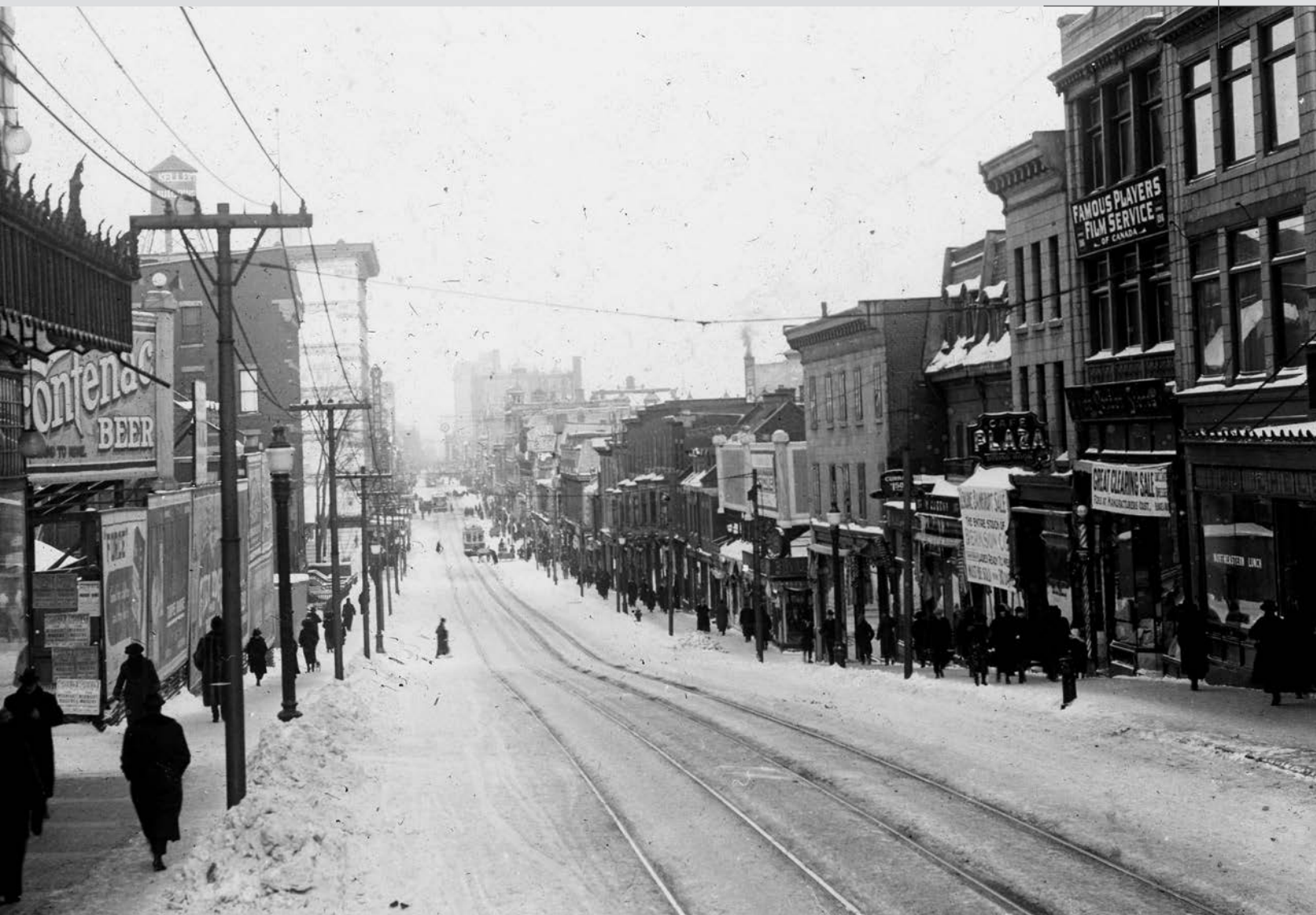
Rue Sainte-Catherine en direction est, à partir de la rue Balmoral, vers 1920. (Archives de la Ville de Montréal, VM98, SY, D5, P102).

des années 1920 ou Le pont Victoria , en 2002. L'année suivante, on assiste au lancement de l'exposition Horizons nouveaux : Nouvelle-France . Issue d'un partenariat entre Bibliothèque et Archives Canada, la Direction des archives de France, le ministère des Affaires étrangères du Canada de même que le ministère de la Culture et des Communications de France, le site est accompagné de la base de données Canada-France comprenant des milliers de pages de documents en lien avec le Régime français provenant de plusieurs institutions dont les Archives nationales du Québec et les Archives départementales françaises.