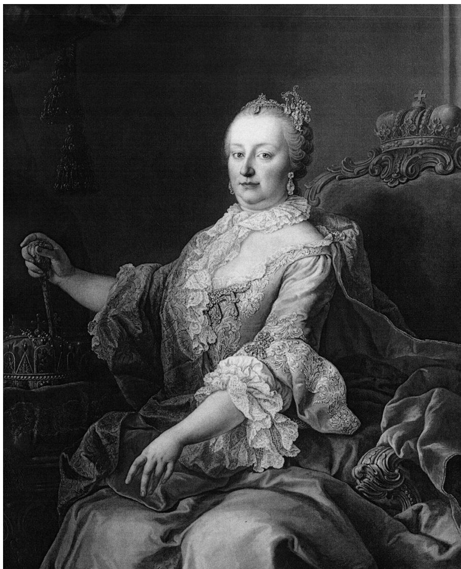
L'impératrice Marie-Thérèse d'Autriche (1717-1780); huile sur toile de Martin van Meytens, 1759, conservée à l'Académie des beaux-arts de Vienne.

Après un début prometteur, l'alliance franco-autrichienne connaît maints déboires. Annus mirabilis pour les uns, annus horribilis pour les autres, l'année 1759 décide du sort de la guerre, alors que, des deux côtés de la Manche, l'opinion publique se fait de plus en plus insistante en faveur de la paix. Les journaux et pamphlets s'indignent des coûts liés aux hostilités. Les problèmes politiques intérieurs minent également le gouvernement des deux royaumes. Accusé d'être un jouet entre les mains de Jeanne-Antoinette Poisson, marquise de Pompadour, sa maîtresse, Louis XV perd le respect de ses sujets et la monarchie de sa superbe. En Angleterre, la mort de George II, en octobre 1760, entraîne l'accession au trône d'un jeune monarque de 22 ans qui, dans une de ses premières déclarations publiques, fait référence à cette guerre « sanglante et onéreuse » qu'il espère voir se terminer le plus rapidement possible. Malgré ses victoires sur terre et sur mer, la Grande-Bretagne se présente ainsi aux négociations de paix dans