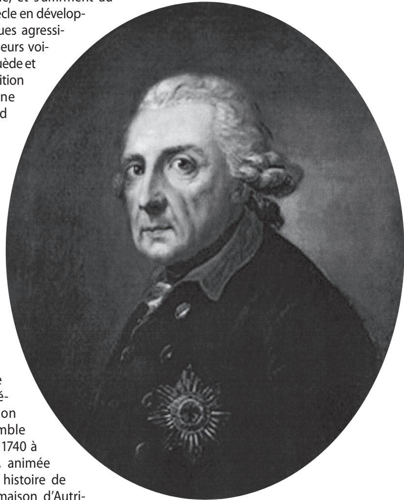
Frédéric II, roi de Prusse (1712-1786); huile sur toile d'Anton Raff, 1781. (Palais de Charlottenburg).

La fortune des armes se divise entre 1744 et 1748. La France s'empare de territoires importants aux dépens des Pays-Bas, traditionnellement protégés par la Grande-Bretagne depuis la fin du Moyen Âge, mais celle-ci réussit à enlever Louisbourg. La paix d'Aix-la-Chapelle rétablit la situation ante bellum , à l'exception de la Silésie que la Prusse peut conserver. L'équilibre européen est ainsi préservé, au grand désarroi des militaires sur le terrain qui ne comprennent pas pourquoi ils doivent abandonner leurs conquêtes. Ainsi, en 1748, le maréchal Maurice, comte de Saxe, qui s'est emparé d'une partie des Pays-Bas au nom du roi de France, ne peut qu'écrire à Jean-Frédéric Philypeaux, comte de