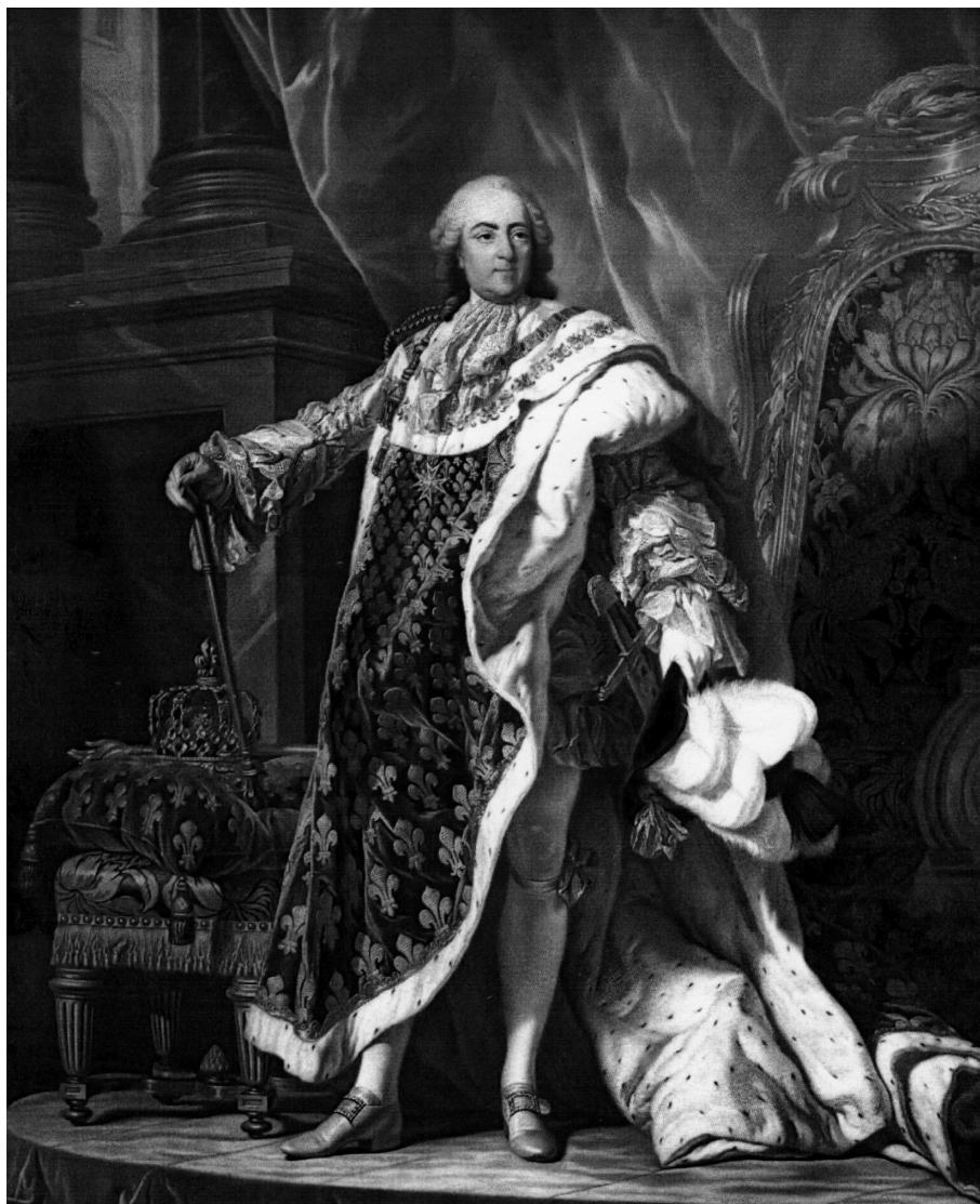
Louis XV, roi de France (1710-1774). Huile sur toile de Louis-Michel van Loo.

La fortune des armes est toutefois capricieuse. En novembre 1757, les troupes prussiennes écrasent les Français à Rossbach, en Saxe. Un mois plus tard, ce sont les Autrichiens qui sont battus à Leuthen, en Silésie. Les armées de Louis XV sont lentement mais sûrement repoussées hors du territoire allemand, alors que les Britanniques montent une offensive en Amérique du Nord. Louisbourg en 1758, Québec en 1759 et plusieurs îles des Antilles tombent entre leurs mains. Dans l'océan Indien, une tentative française de s'emparer de Madras échoue. Désireux de reprendre l'offensive, le gouvernement français prépare un plan d'invasion de la Grande-Bretagne, mais les navires