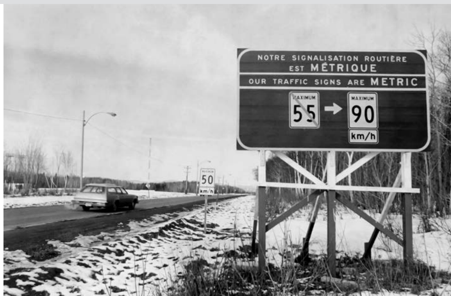
Panneau routier illustrant l'époque de la conversion au système métrique.

Dans un article substantiel intitulé « Le numérotage des routes » qui fait la page couverture du Bulletin en juin 1926, on présente ainsi un nouveau système : « Depuis le début de la saison, les automobilistes ont remarqué sur un certain nombre de routes une plaque blanche sur laquelle est dessiné le contour de la feuille d'érable reproduit sur cette page et encadrant un ou deux chiffres. C'est là la plus récente addition faite par le ministère de la Voirie aux signaux routiers jusqu'ici en usage ». Selon ce système, la route 1 reliait Montréal à Sherbrooke; la route 2 unissait Montréal à Québec par la rive nord; la route 3 partait de Lévis jusqu'à Saint-Lambert. La route 9 entre Longueuil et l'État de New York était surnommée la route Édouard VII (en l'honneur du roi