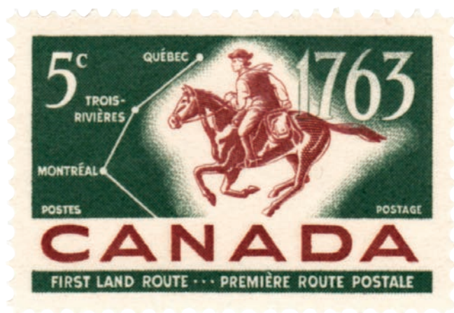
Première route postale. Timbre émis par Postes Canada en 1963. Société Canadienne des postes ©. (Collection Yves Beauregard).