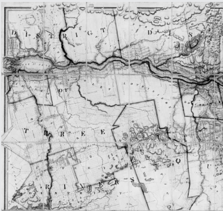
Extrait de la carte de Joseph Bouchette de 1831 qui illustre les chemins mentionnés dans le texte.

des difficultés d'entretien. Le piteux état du chemin ne favorisera guère sa fréquentation sur de longues distances. Par ailleurs, les pionniers des cantons Wendover et Simpson se plaignent, en 1812, de l'absence de voie légalement établie. Des chemins longent les cours d'eau là où il existe des établissements, mais ces sentiers ne suffisent plus et la rivière Saint-François demeure le principal moyen de communication,