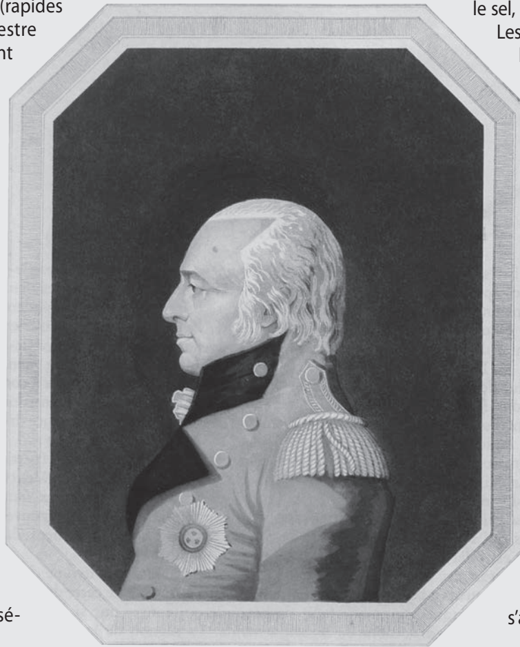
James Henry Craig (1748-1812). Gouverneur général du Canada de 1807 à 1811, il fait aménager un chemin qui va de la seigneurie de Saint-Gilles jusqu'à Shipton à travers les cantons.