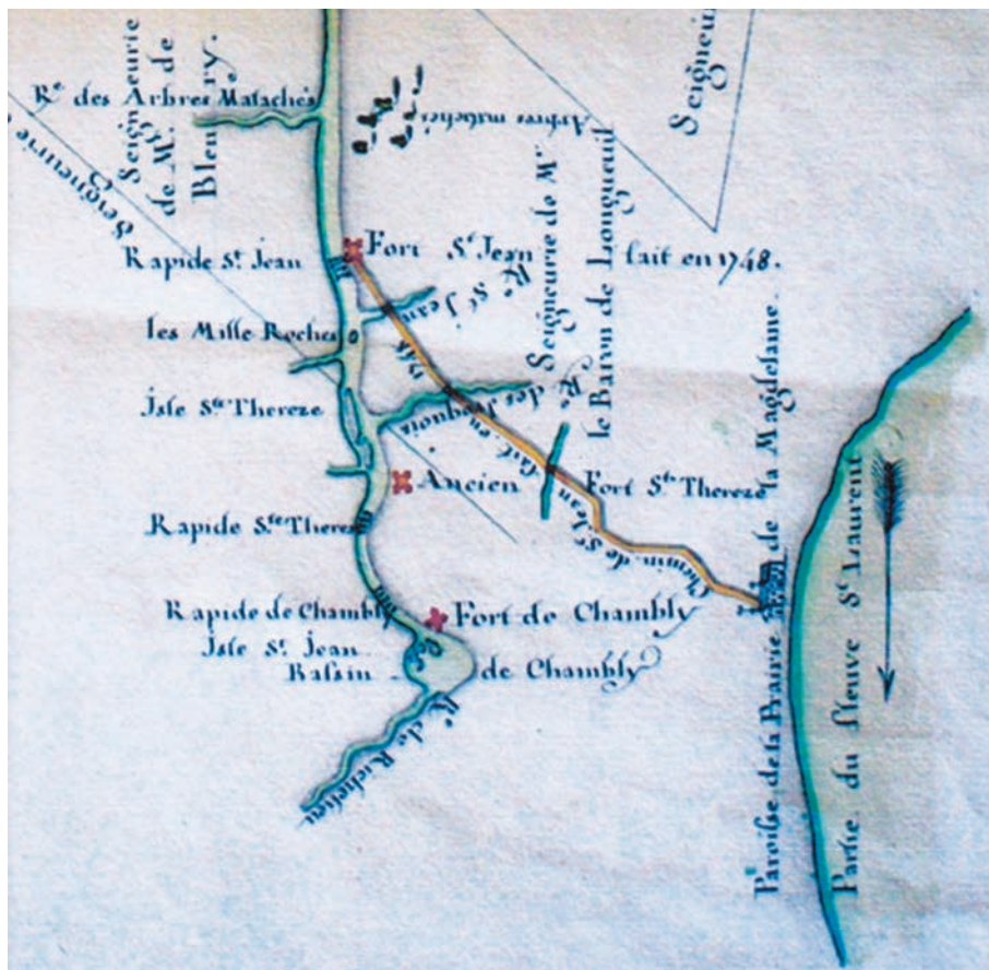
Extrait de la carte du lac Champlain, 1752. Louis Franquet. (Original conservé aux Archives du Séminaire de Québec, Musée de la civilisation, Québec).

Jusqu'à la Révolution américaine, le portrait du transport de la Province of Quebec n'évolue guère. Ainsi, les trois plus