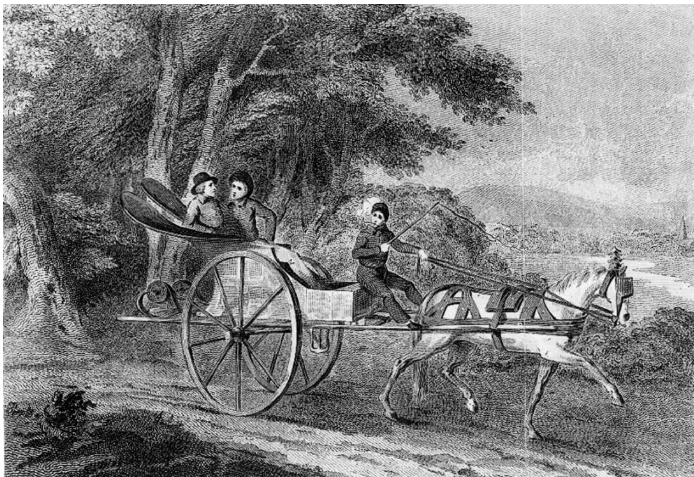
Canadian Calash or Marche-Donc. Gravure publiée en 1798. Isaac Weld, dessinateur; J.B. Drayton, graveur.

À cette route de canotage s'en ajoutent d'autres, dont celle du Saguenay, qui mène au système hydrographique de la baie d'Hudson. De même, le Richelieu permet au bois (douves et madriers) du lac Champlain d'être acheminé par radeau vers Québec et aux pelleteries montréalaises d'être vendues sur le marché new-yorkais. Par ailleurs, en hiver, tant les Innus nord-côtiers que des habitants de la colonie naviguent en canot à travers les glaces.