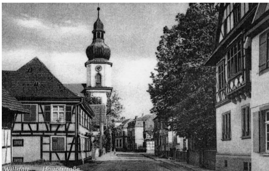
Willstät (Bade). Carte postale, vers 1920.

Toujours dans le fonds d'archives du Colonial Office, le 7 mars 1791, George Grenville informe Dorchester qu'à la suite des recherches faites en Russie et dans les pays voisins pour y trouver des personnes au fait de la culture du chanvre, un individu s'est présenté et son offre a été acceptée. L'homme, d'ori-