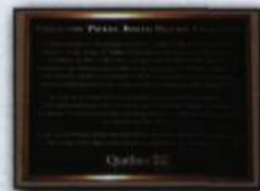
Plaque de la collection Pierre-Joseph-Olivier-Chauveau, conservée à la bibliothèque de l'Assemblée nationale. Photographie de Sylvain Lizotte, 2006. Répertoire du patrimoine culturel du Québec . (Ministère de la Culture, des Communications et de la Condition féminine).

Jean-François Drapeau Direction du patrimoine et de la muséologie, Ministère de la Culture, des Communications et de la Condition féminine