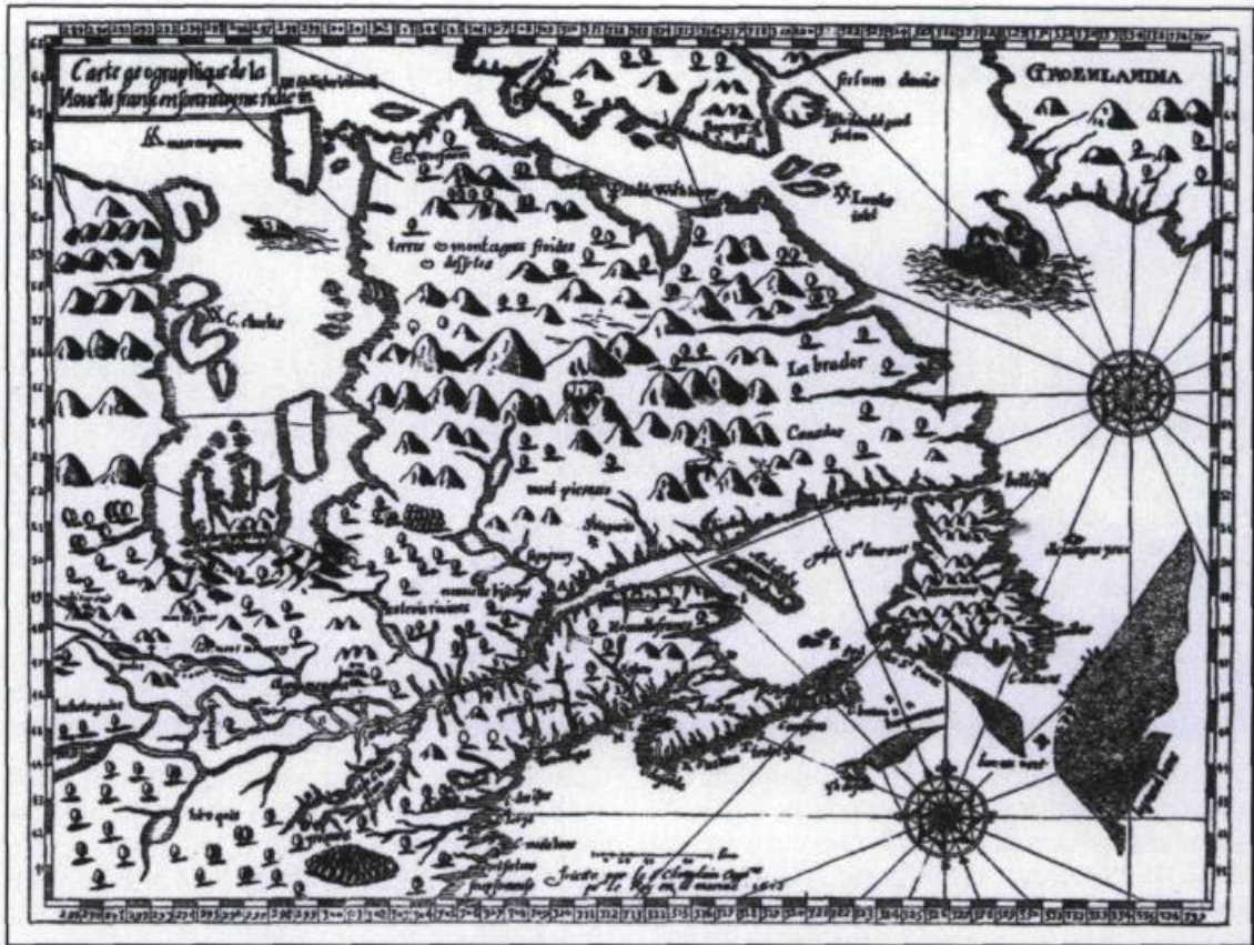
Carte géographique de la Nouvelle-France en son vray méridien. Champlain, 1613.

un immense territoire « arrosé des plus beaux fleuves du monde ». Toujours à l'intention du roi, il insiste sur les revenus que procurerait le trafic des « marchandises qui viendraient de la Chine et des Indes » et la douane perçue pour profiter d'un « raccourcissement de plus d'un an et demi de temps ». Enthousiaste, « s'il plaît à Dieu et au Roi », Québec « assise sur la rivière Saint-Laurent, en un détroit d'icelle rivière », « s'appellera Ludovica ».