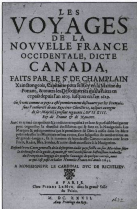
Samuel de Champlain. Les voyages de la Nouvelle France Occidentale, dicte Canada... Paris, Pierre Le-Mur, 1632 (page de titre).

À son retour en France (1603), Champlain apprend le décès d'Aymar de Chaste. Fort affligé, il s'inquiète et cherche « un Seigneur de qui l'autorité fut capable de repousser l'envie ». « Je sais, poursuit-il, qu'aussitôt plusieurs marchands de France qui avaient intérêt en ce négoce, commençaient à faire des plaintes de ce qu'on leur interdisait le trafic des pelleteries, pour le donner à un seul ». Il quitte rapidement Honfleur pour aller trouver Sa Majesté, « à laquelle je fis voir, raconte-t-il, la carte du dit pays, avec le discours