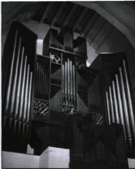
Orgue Beckerath (1959) de l'oratoire Saint-Joseph du Mont-Royal (Montréal). Carte postale, vers 1960. (Coll. Yves Beauregard).

couvre bien l'événement : on peut suivre chaque semaine les différentes tendances et les dernières avancées. En 1963, arrive un nouveau pape, Paul VI, qui paraît tout aussi novateur, avec ses voyages dans le monde : le premier à Jérusalem (1964), le deuxième à Bombay, en Inde, le troisième à l'ONU, en 1965, alors qu'il lance : « Jamais plus la guerre! »