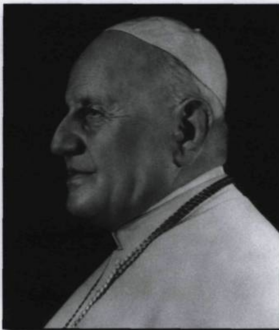
Le pape Jean XXIII (Angelo Giuseppe Roncalli, 1881-1963) convoque le deuxième concile du Vatican, en 1962. Carte postale photographique, vers 1960.