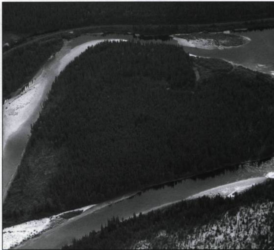
■ Cœur de la rivière Moisie. Photo : Pierre Lahoud, 2005. (Archives de l'auteur).

En 1976, la Direction générale du patrimoine entreprenait un projet pour dégager une vue d'ensemble de la richesse patrimoniale du Québec et en relever les concentrations ou les thèmes susceptibles de faire l'objet de recherches ultérieures. Ce macro-inventaire , comme on l'a appelé, sollicitait l'apport de plusieurs disciplines, mais le volet qui a le plus contribué à son originalité a été sans contredit l'inventaire aérien qui est rapidement