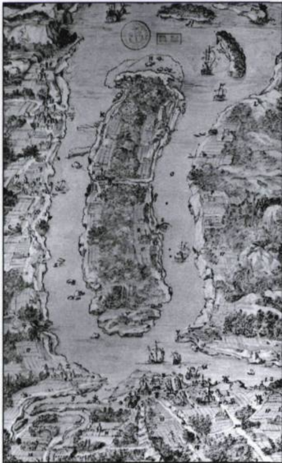
L'Entrée de la Rivière et St. Laurent et la ville de Québec dans le Canada, vers 1690.