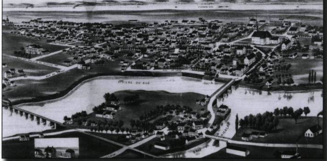
Vue à vol d'oiseau de Montmagny, P.Q. 1881, réalisée par la Compagnie aérienne franco-canadienne. (Archives nationales du Québec à Québec).

un état des lieux de la planète et nous amènent à s'interroger sur leur pérennité et leur devenir. Ces photographies aériennes du patrimoine universel nous parlent en même temps de la beauté de la terre et de l'urgence d'intervenir pour la protéger.