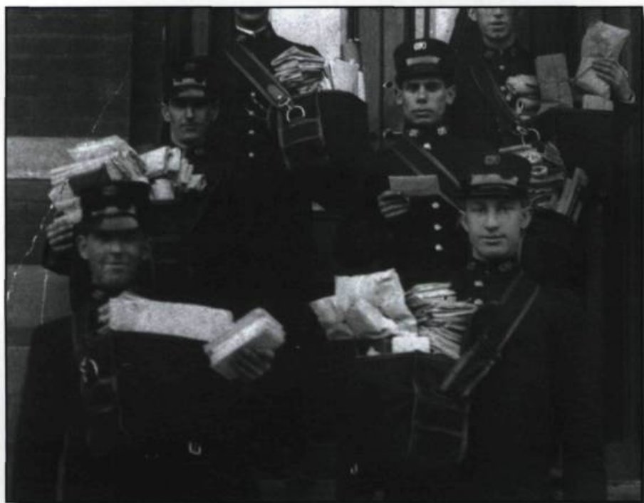
Chargés de courrier et tous en uniforme, les facteurs sont prêts à partir.

Qui n'a pas déjà aperçu son facteur à l'œuvre sillonnant les rues de la ville, le sac rempli de lettres et de factures? Sa présence est essentielle au bon fonctionnement d'une société qui repose sur l'écrit. Il a une longue histoire ce porteur de nouvelles dont les origines remontent à l'Antiquité, à l'époque de l'invention de l'écriture. Pour les fins de cette chronique, nous examinerons l'histoire plutôt récente, celle des 130 dernières années.