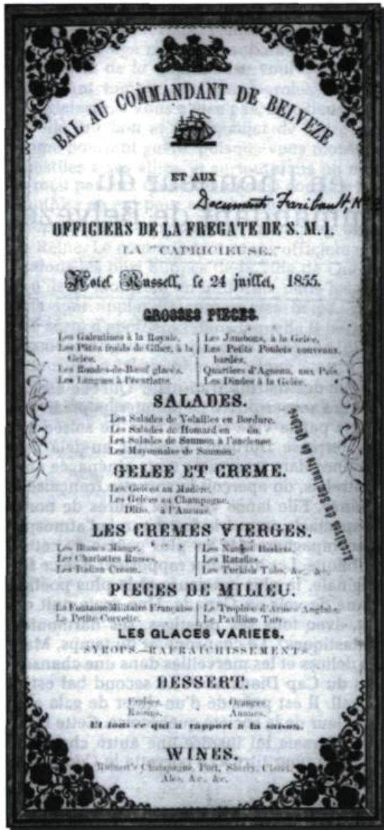
Menu du bal au commandant de Belvèze et aux officiers de la frégate de SMI La Capricieuse à l'hôtel Russel, Québec, le 24 juillet 1855. (Archives du Séminaire de Québec).

Sans doute, mais les paroles des élites ont un accent de sincérité que l'humble ouvrier des quartiers populaires ressent lui aussi dans sa mansarde de bois rond, où il n'y a point de napperon brodé sur la table ni de lingerie fine dans les armoires façonnées par les artisans des campagnes, mais où les cœurs battent aux mêmes évocations que ceux des lettrés, des clercs et des politiciens.